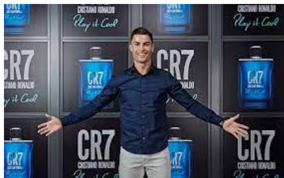
Slika 8. CR7 brand.