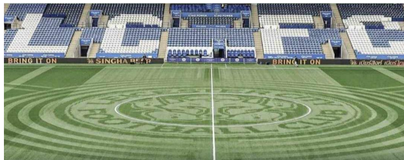
Slika 6. Logotip na travi.