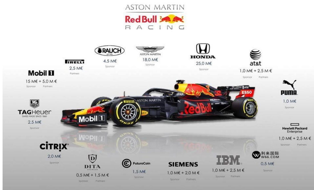
Slika 10. Sponzorstva na bolidu Red Bull-a.

Kao jedan od najboljih primjera oglašavanja na sportskom događaju može se uzeti Formula 1 na kojoj se gledatelji (navijači) susreću sa oglasima kroz svoj cjelodnevni boravak na stazi. Od petka, kada počinje F1 vikend, pa sve do nedjelje, navijači su bombardirani oglasima kako na stazi tako i oko nje. Formula 1 je poznata po svojoj visokoj brzini akcije i uzbuđljivoj konkurenciji, ali također je i važna platforma za oglašavanje. Poduzeća koriste sport da promoviraju svoje marke i proizvode globalnoj publici, a oglasi se pojavljuju na svemu od trkaćih automobila i uniforma vozača do obilježavanja staze i televizijskih prijenosa. Samo ime utrke sadrži ime sponzora npr. „Formula 1 Rolex Australian Grand Prix“. Mnogi od najvećih svjetskih brendova, uključujući proizvođače luksuznih automobila, energetske napitke i tehnološke tvrtke, sponzoriraju momčadi Formule 1 ili imaju sponzorske ugovore sa sportom. Oglašavanje Formule 1 višemilijunska je industrija koja godišnje pridonosi uspjehu i popularnosti sporta. Sponzoriranje F1 momčadi košta više od 100.000 dolara, a neki od najvećih online sponzora plaćaju preko 200 milijuna dolara za sponzoriranje oko momčadi. Trošak sponzoriranja momčadi Formule 1 može uvelike varirati ovisno o veličini i angažmanu same tvrtke. Naprimjer, manje tvrtke obično plaćaju između 500.000 i 750.000 dolara, dok veće tvrtke mogu potrošiti milijune dolara godišnje podržavajući F1 sponzorstva.