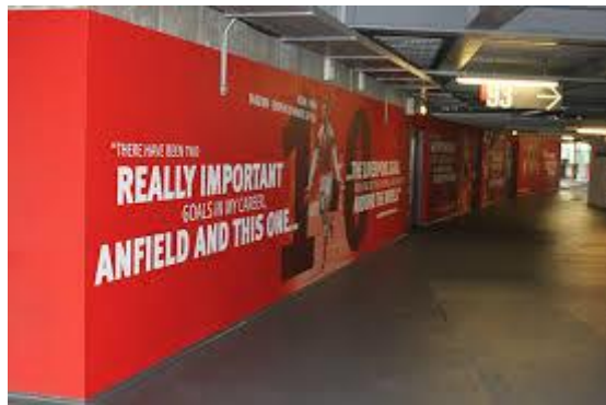
Slika 5. Unutarnji branding stadiona.