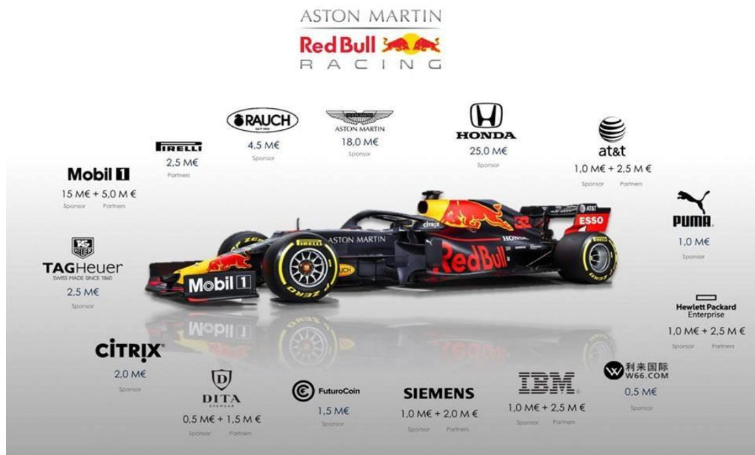
Slika 10. Sponzorstva na bolidu Red Bull-a.

Kao jedan od najboljih primjera oglašavanja na sportskom događaju može se uzeti Formula 1 na kojoj se gledatelji (navijači) susreću sa oglasima kroz svoj cjelodnevni boravak na stazi. Od petka, kada počinje F1 vikend, pa sve do nedjelje, navijači su bombardirani oglasima kako na stazi tako i oko nje. Formula 1 je poznata po svojoj visokoj brzini akcije i uzbuđljivoj konkurenciji, ali također je i važna platforma za oglašavanje. Poduzeća koriste sport da promoviraju svoje marke i proizvode globalnoj publici, a oglasi se pojavljuju na svemu od trkaćih automobila i uniforma vozača do obilježavanja staze i televizijskih prijenosa. Samo ime utrke sadrži ime sponzora npr. „Formula 1 Rolex Australian Grand Prix“. Mnogi od najvećih svjetskih brendova, uključujući proizvođače luksuznih automobila, energetske napitke i tehnološke tvrtke, sponzoriraju momčadi Formule 1 ili imaju sponzorske ugovore sa sportom. Oglašavanje Formule 1 višemilijunska je industrija koja godišnje pridonosi uspjehu i popularnosti sporta. Sponzoriranje F1 momčadi košta više od 100.000 dolara, a neki od najvećih online sponzora plaćaju preko 200 milijuna dolara za sponzoriranje oko momčadi. Trošak sponzoriranja momčadi Formule 1 može uvelike varirati ovisno o veličini i angažmanu same tvrtke. Naprimjer, manje tvrtke obično plaćaju između 500.000 i 750.000 dolara, dok veće tvrtke mogu potrošiti milijune dolara godišnje podržavajući F1 sponzorstva.