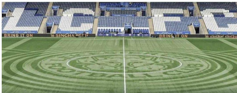
Slika 6. Logotip na travi.