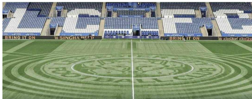
Slika 6. Logotip na travi.