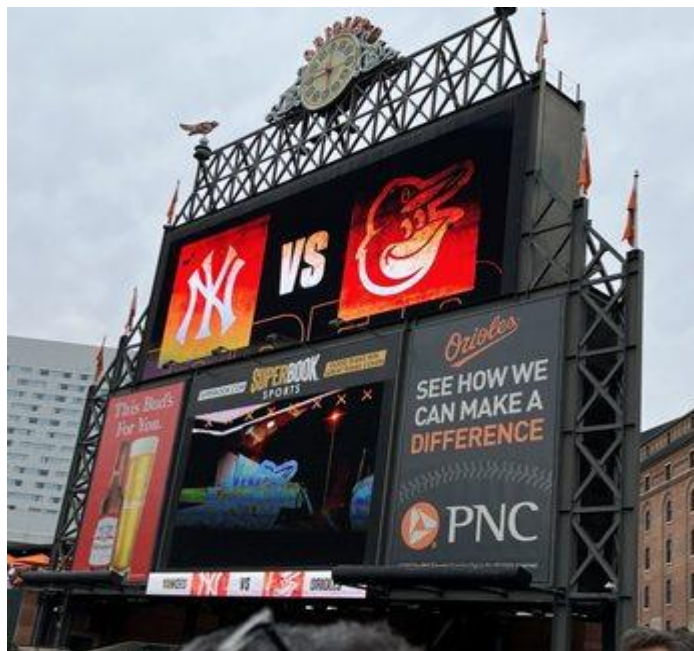
Slika 3. Primjer billboarda u SAD-u.

poruke. Billboardi su često vidljivi tijekom prijenosa utakmica, što omogućuje izlaganje robnih marki velikom broju gledatelja.