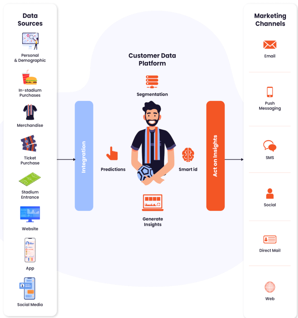
Slika 12. Primjer rada CDP-a

Uzmimo za primjer nogometni klub koji želi povećati sponzorsku vrijednost svojim partnerima, neki od ključnih pokazatelja koji bi trebali pratiti su: