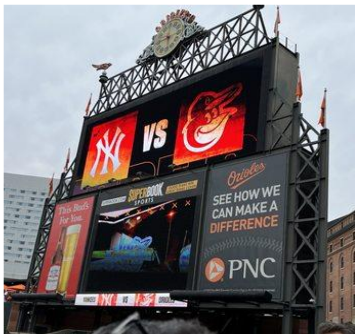
Slika 3. Primjer billboarda u SAD-u.

poruke. Billboardi su često vidljivi tijekom prijenosa utakmica, što omogućuje izlaganje robnih marki velikom broju gledatelja.