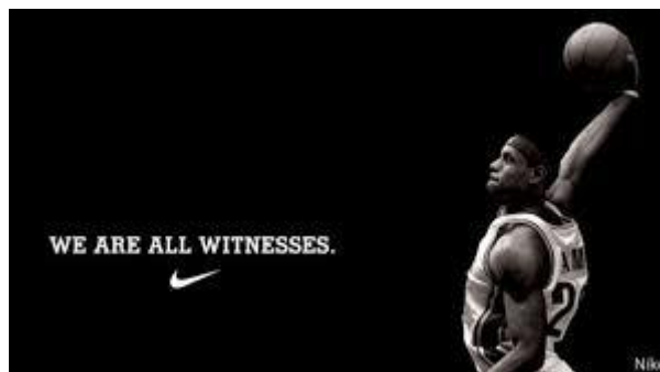
Slika 9. Nike kampanja sa LeBron James-om. (Prisutpljeno: 24.6.2023.)

Također jedan od poznatijih primjera sponzorstva individualnih sportaša su Michael Jordan i LeBron James, NBA košarkaši koji imaju doživotne ugovore sa kompanijom Nike, te imaju svoje linije tenisica i odjeće. Nije slučajno da tijekom prijenosa utakmica, kamera najviše vremena provede na osobama koje su globalne ikone poput Ronalda ili James-a, jer sama njihova pojava na terenu, televiziji ili u dvorani budi prepoznatljivost branda kod svih ljudi koji znaju tko su oni.