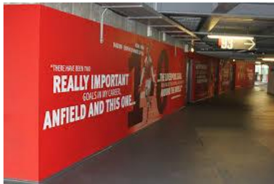
Slika 5. Unutarnji branding stadiona.