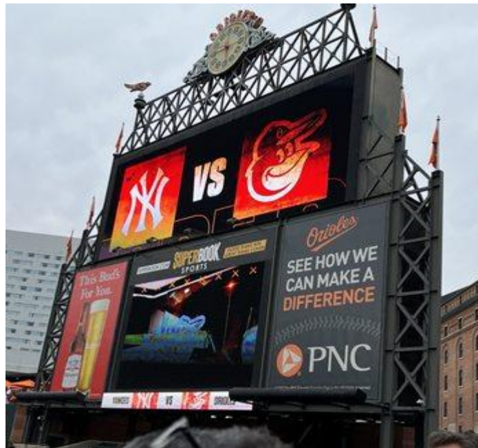
Slika 3. Primjer billboarda u SAD-u.

poruke. Billboardi su često vidljivi tijekom prijenosa utakmica, što omogućuje izlaganje robnih marki velikom broju gledatelja.