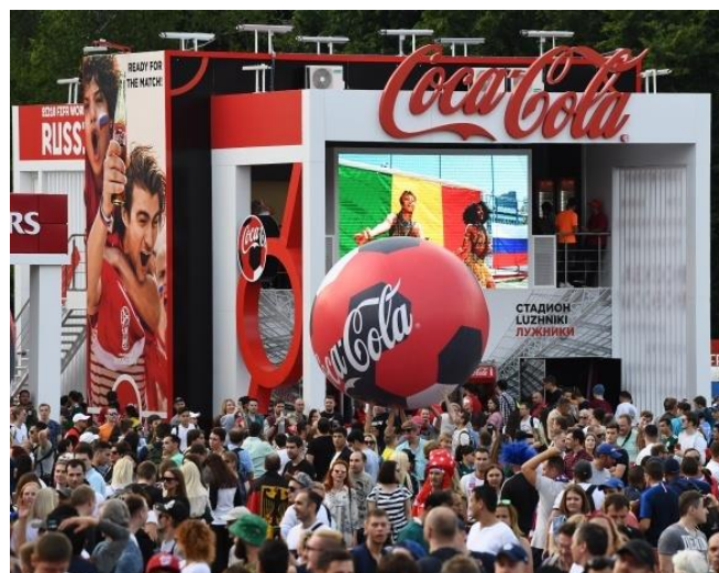
Slika 12. Coca-Cola display na SP-u u Rusiji 2018.

Coca-Cola je snažno uključena u sportski marketing, u partnerstvu je s organizacijama kao što je FIFA. FIFA organizira Svjetska prvenstva u nogometu te je surađivala sa Coca-Colom kako bi pokrenuli dinamičnu marketinšku kampanju u ljeto 2018 za SP u Rusiji. Njihov pristup bio je usmjeren na održavanje navijača i onih koji su uključeni u turnir te im pružiti, čarobno iskustvo. Ciljali su na uključivanje, održivost i razvoj nogometa mladih. Marka shvaća goleme prednosti koje takva utjecajna partnerstva mogu imati, omogućujući robnoj marki pića ciljanje velikog broja demografskih skupina, dok ljudi diljem svijeta prate Svjetsko nogometno prvenstvo. Štoviše, Coca-Cola je 2019. godine postala sedmi službeni partner Engleske Premier lige koja je najjača liga svijeta. Uz brojne napore koje ulažu na glavnim terenima koji su globalno prepoznatljivi, financiraju i razne kampove za mlade nogometaše diljem svijeta, osobito u Africi i Južnoj Americi.