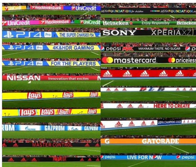
Slika 4. Primjer LED oglašavanja.