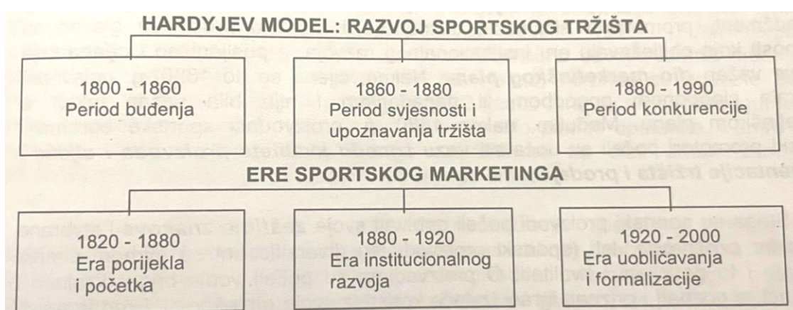
Tablica 1. Stephen Hardyjev model razvoja sportskog marketinga za SAD.

Kada je sportsko tržište uzelo zamah i pretvorilo se u globalnu atrakciju teško je zapravo utvrditi. Pretpostavka Novaka je privlačnosti samih igara u kombinaciji s kladenjem i kockanjem u sportu radi brze zarade. Novak navodi kako povijesna veza između ekonomije i sporta datira iz 19. stoljeća razvojem modela sportskog marketinga u Sjedinjenim Američkim Državama od strane Stephen Hardyja. (Novak, 2006:34)