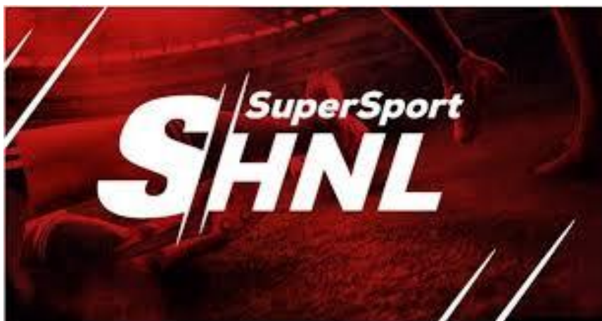
Slika 7. SuperSport HNL sponzorstvo.