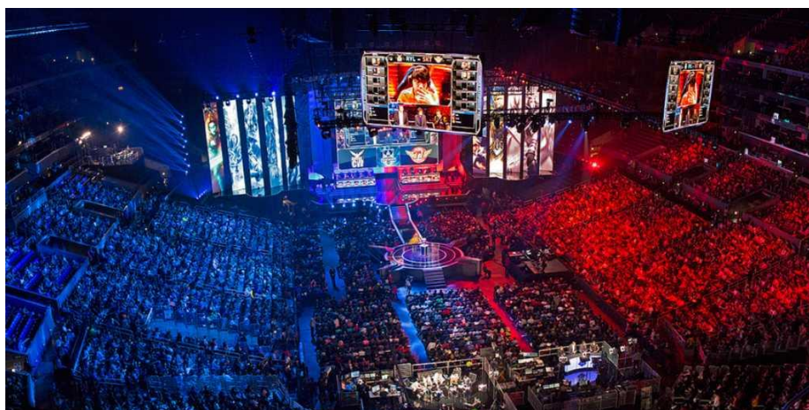
Slika 13. Organizacija eSports događaja.