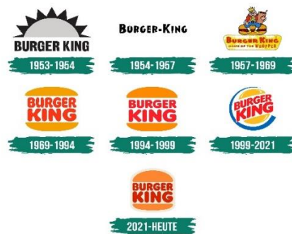
Slika 1: Logo Burger Kinga tokom godina