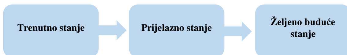
Slika 2. Tranzicija organizacijske promjene

U današnjem dinamičnom okruženju, kada se očekivanja uvijek mijenjaju i neprestano se pojavljuju novi problemi, upravljanje promjena mora se provoditi brzo i izravno. Cummings i Worley (2005) tumače kako provedba organizacijske promjene uključuje prelazak iz postojećeg organizacijskog stanja u željeno buduće stanje. Slikom 2. prikazano je da se takvo kretanje ne događa odmah, već ono zahtijeva prijelazno razdoblje tijekom kojeg organizacija uči kako implementirati uvjete potrebne za postizanje željene budućnosti.