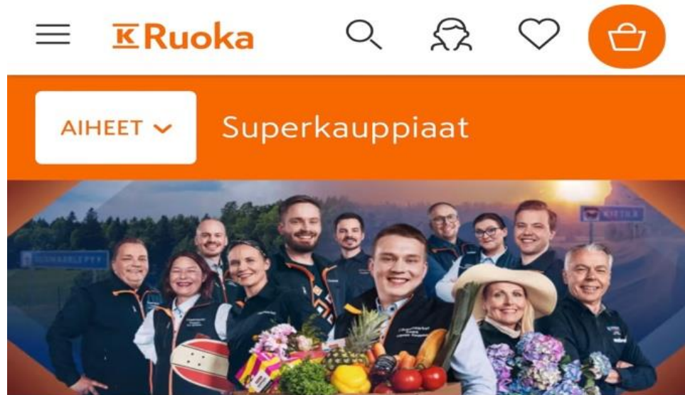
Slika 2 Naslovna slika Web stranice supermarketa

Supermarketu nakon gledanja programa. Zbog svog uspjeha, "The Super Merchants" će se vratiti u drugoj sezoni u proljeće 2022. na istom kanalu.