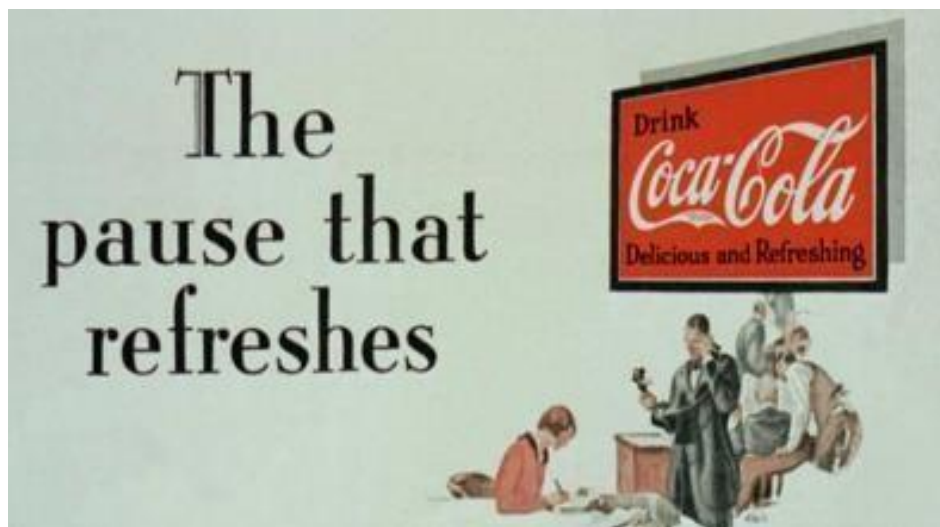
Slika 1. Prikaz Coca-colinog oglasa

J. Walter Thompson smatra se prvom američkom agencijom koja je međunarodno proširenje ostvarila pomoću otvaranja njihove podružnice na području Londona 1899. godine. Ona se proširila u cijelom svijetu, a sve to na takav način da je postala jedna od prvotnih američkih agencija na području Azije, Egipta i Južne Afrike. Početkom 20. stoljeća došlo je do prvotne pojave televizije, a samim time i drugih načina oglašavanja. Poduzetnici i oglašivači su imali ogroman zadatak, a to je bilo osmišljavanje novog koncepta oglasa za šire mase preko tv-a. Posebno se potrebno osvrnuti na nekoliko ključnih reklama koje su obilježile povijest oglašavanja na početku 20. stoljeća, Coca-cola („Pauza koja osvježava“), takvom reklamom se pružio zapanjujući primjer kroz podizanje nacije u depresivno doba, a sve to kroz zagovaranje proizvoda koji je dao emocionalno zadovoljstvo i zadovoljstvo fizičkih potreba onih koji su ga kupovali. Kako bi brend dodatno bio približen građanima, tijekom Drugog svjetskog rata, cijena ovog proizvoda je bila samo 5 centi po boci. U nastavku na slici je prikazan primjer oglasa Coca-cola (Brakus, 2015).