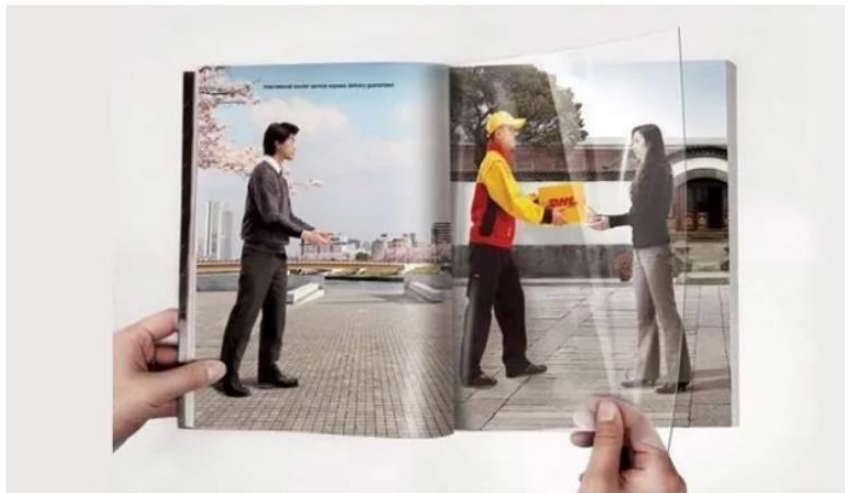
Slika 7. Kreativnost u oglašavanju tvrtke DHL