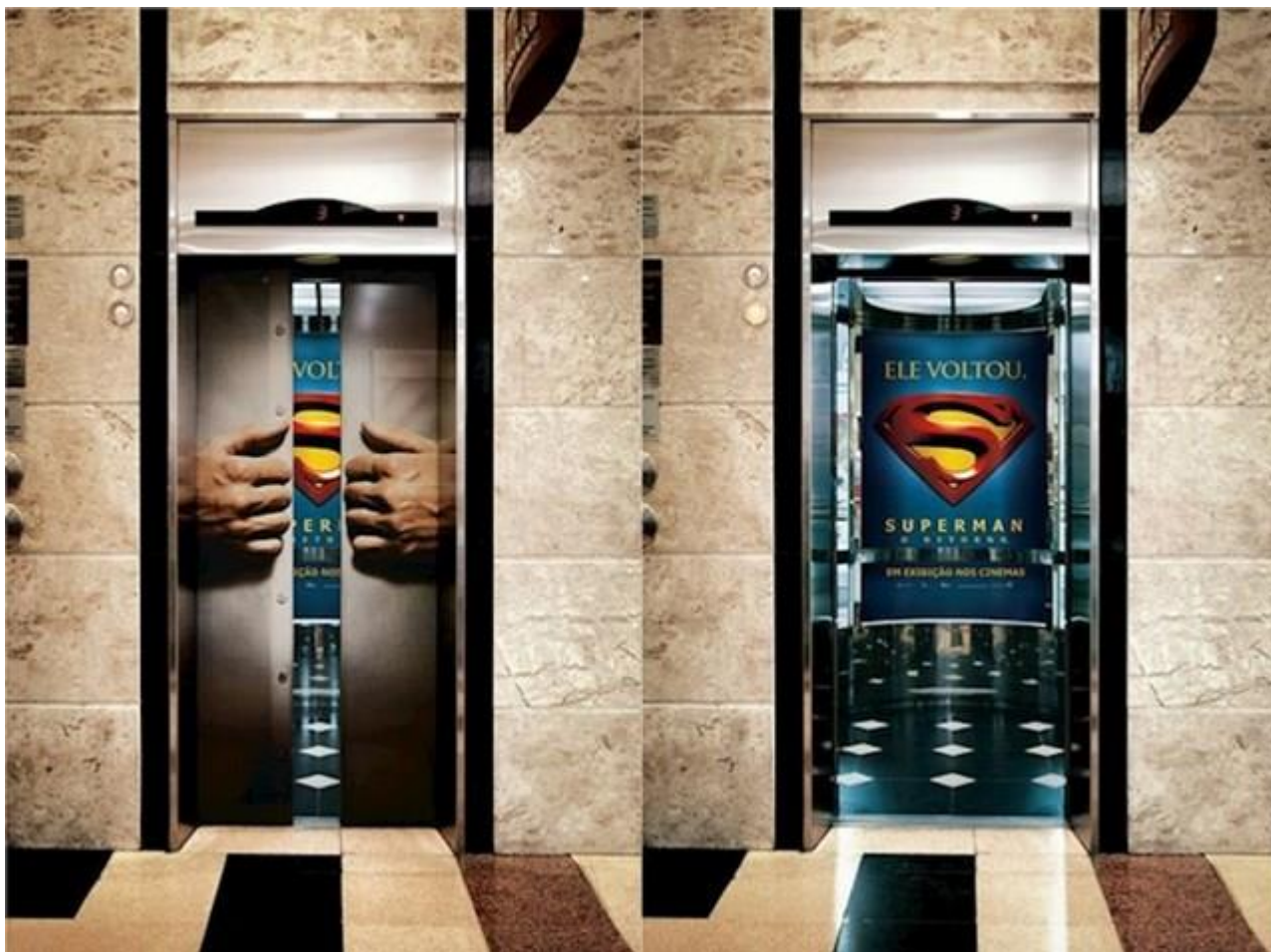
Slika 8. Kreativnost u oglašavanju filmova u dizalu

Izvor: https://www.index.hr/lajk/poster/237997/11-fora-reklama-na-dizalima-koje-ce-vas-oduseviti-svojom-kreativnoscu