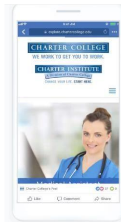
Slika 3. Slideshow oglas

Ovakva vrsta oglasa se smatra jednostavnim načinom za stvaranje video uradaka od kolekcija fotografija, tekstova ili video isječaka koji veće postoji. Ukoliko nemate vlastite slike, mogu se odabrati fotografije izravno iz upravitelja oglašavanja. Takav oblik oglašavanja ima faktor kretnje koji znatno privlači pažnju, ali isto tako ima puno manju širinu pa se vrlo brzo može učitati čak i onim korisnicima koji imaju sporiju internetsku vezu (Viher, 2021).