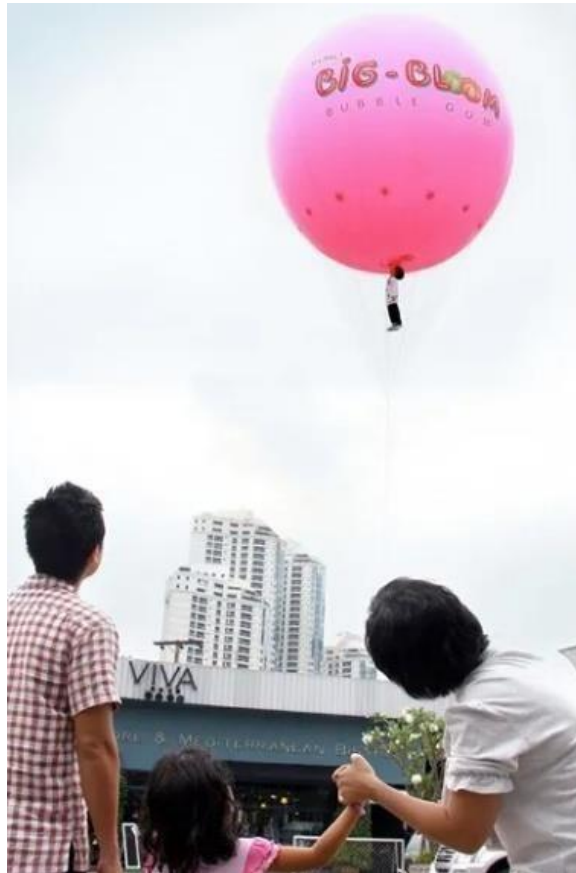
Slika 9. Kreativni oglas tvrtke Big bloom