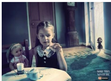
Slika 6. Kreativnost u oglašavanju tvrtke Duracell

„Bijesan zec“ koji se koristi Duracell baterijom već dugi niz godina živcira građane. Zaposleni u agenciji za oglašavanje Gray koja ima sjedište u državi Singapur oglas su napravili na malo drugačiji način, kroz crni humor. Djevojčica je pomislila kako je njena stara igračka uništena i bacila ju je. Ali ta igračka više nije bila tamo, ova baterija je dala mogućnost lutki da se vrati nazad i brutalno se osveti toj djevojčici. Prikladan slogan na njihovim posterima je bio da neke igračke nikad ne umiru.