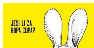
Slika 5. Primjer apela za humor

Ova vrsta apela u porukama sadržava humor koji privlači pozornost i ima dobar stupanj retencije kod potrošača. Glumci, profesori, političari i svi koji komuniciranje smatraju dijelom svoje profesije koriste humor ponekad kako bi dobili pozornost i željenu reakciju. Kroz humor se obraća pozornost primatelja te se izaziva pozitivno raspoloženje čime dolazi do povećanja sklonosti i prihvaćanja proizvoda. Poruke u oglašavanju humor izražavaju na verbalni i vizualni način, kroz viceve, šalu ili igru riječima. Korištenja apela s humorom je vrlo široka pojava. Međutim, postoje mišljenja pojedinih stručnjaka koja apele s elementima humora vide kao nešto što može imati negativan učinak na potrošače ovisno o razini ozbiljnosti koja se očekuje prilikom tržišnog komuniciranja i prirode same ponude. Humor često zna unijeti dozu zanimljivosti u komunikaciju kod inače očekivanog i uobičajenog oglasa. Humor često puta zna biti rizična pojava, stoga tvrtke moraju upoznati svoju publiku prije nego li se posvete bilo čemu što može dovesti do negativne pažnje ili nesporazuma. Tijekom ovog poglavlja se moglo uvidjeti da postoje razne vrste apela kroz koje se može privući mnogobrojne kupce, a to je od velike pomoći za tvrtke (Stolac&Vlastelić, 2014).