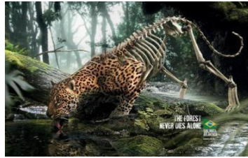
Slika 4. Primjer apela za strah

Ukoliko postoji razina straha koja je niža tada ne dolazi do skretanja pažnje, a ukoliko se koristi visoke razine straha, ljudi izbjegavaju poruku ili je potpuno ignoriraju. Vizualnom slikom oglasi mogu dovesti do privlačenja skrivenog straha. Neki oglasi dovode do osobnog straha, dok drugi dovode do osjećaja gubitka.