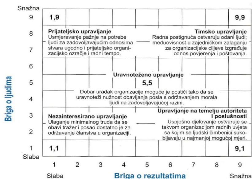
Slika 2 Mreža vodstva

Uz sve navedeno, pristup temeljen na stilu čine 5 različitih stilova vodstva, a to su: upravljanje temeljeno na autoritetu i poslušnosti, prijateljsko upravljanje, nezainteresirano upravljanje, uravnoteženo upravljanje, te timsko upravljanje.