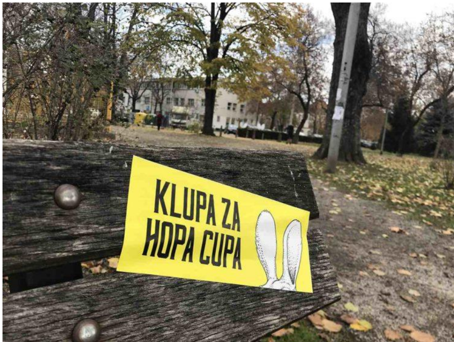
Slika 6: Primjer guerilla marketinga - Hopa Cupa by Heineken

Odličan hrvatski primjer guerilla kampanje odradila je zagrebačka agencija Imago Ogilvy u suradnji sa Heinekenom. Kampanja nosi naziv „Hopa Cupa“ i vezana je uz napitak, točnije sok od limuna s hmeljom. Kampanja je uspjela probuditi interes. Na slikama su vidljiva različita pitanja koja su smještena na žutoj podlozi i uz njih se nalaze zečje uši. „Cijela kampanja bila je usmjerena na one ljude snažnog karaktera koji se ne srame pokazati svoje pravo „ja“ i koji ne prezaju pred konzervativnim društvenim normama“ (Media marketing 2018).