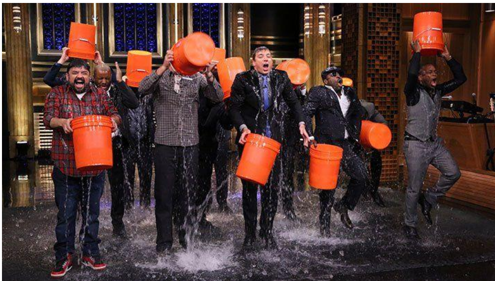
Slika 2: Primjer viralnog marketinga - Ice Bucket Challenge

Kampanji započetoj u srpnju 2014. godine pod nazivom Ice Bucket Challenge cilj je bio podići svijest o bolesti amiotrofične lateralne skleroze (ALS), bolest motoričkih neurona koji uzrokuju oštećenje mišića. Cilj same kampanje bio je donirati novce udruzi koji boluju od navedene bolesti ili postavljanje videa na društvene mreže.