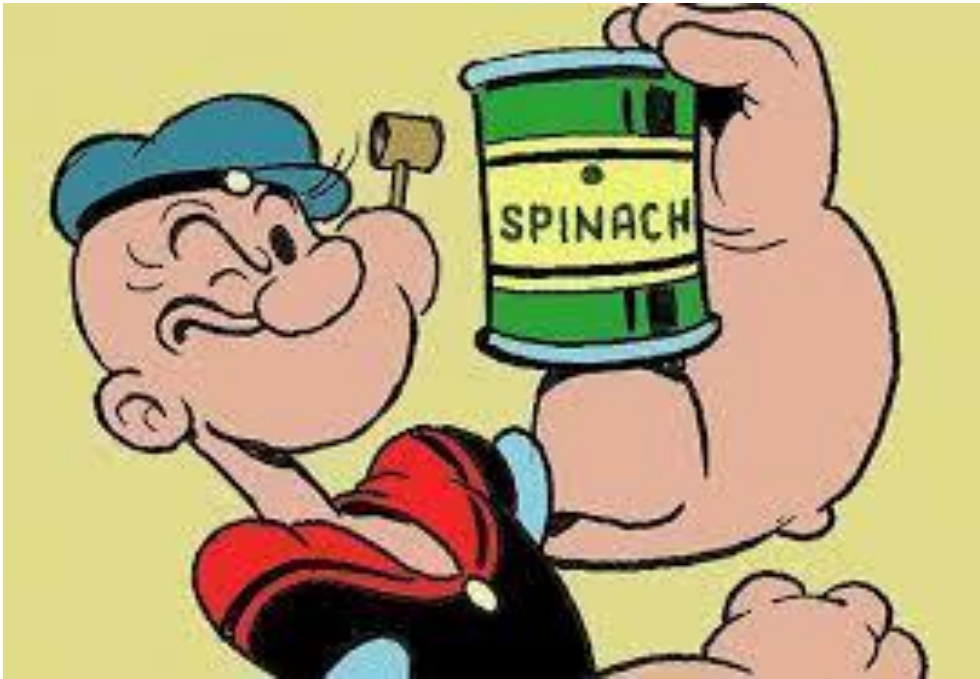
Slika 10: Primjer prikrivenog oglašavanja - Mornar Popaj i špinat