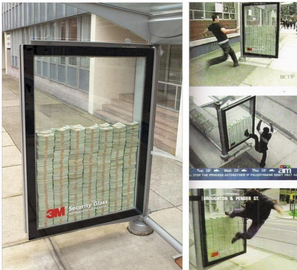
Slika 8: Primjer guerilla marketinga – 3M

nanese na nj. Publika je bila izazvana razbiti staklo, ako to učine, otišli bi s novcem. Genijalna marketinška kampanja kojoj nitko ne bi mogao odoljeti ne pokušati razbiti staklo. Tu je postojala prednost i za 3M koji bi ponovno ukazali na snagu Scotchshielda. Postojalo je nekoliko osnovnih pravila od kojih je jedno da se prilikom pokušaja razbijanja stakla moglo isključivo koristiti svoje noge. U blizini su stajali zaštitari koji su osiguravali ne kršenje pravila. Nekoliko godina kasnije se otkrilo da je dio novčanica bio lažan te ukoliko bi netko i razbio staklo, bio bi nagrađen na drugačiji način. Kampanja je trajala 1 dan i kada nitko nije uspio, uklonjena je. Troškovi kampanje bili su minimalni uz najam kućišta i zaštitare za jedan dan. Minimalni troškovi koji su imali velik povrat ulaganja.