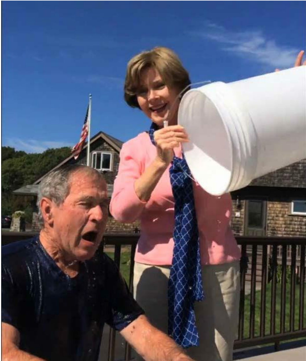
Slika 4: Primjer viralnog marketinga - Ice Bucket Challenge - George W. Bush

predsjednik George W. Bush također se pridružio viralnoj kampanji i ujedno popisu političara koji su ju odradili. Jenna Bush Heger, kćerka je izazvala svog oca nakon čega je on snimio videozapis i objavio ga na društvenoj mreži. Na videozapisu je vidljivo kako supruga zalijeva bivšeg predsjednika kantom vode i leda.