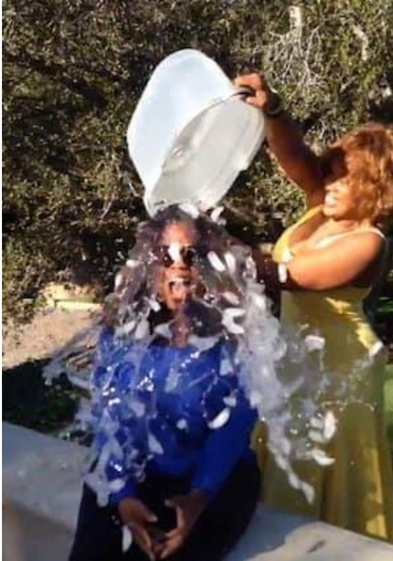
Slika 3: Primjer viralnog marketinga - Ice Bucket Challenge – Oprah Winfrey Izvor: Clear Admit ( https://www.clearadmit.com/2014/08/business-school-students-accept-als-ice-bucket-challenge-pass/ )

strane 440 milijuna ljudi. Posebnu pozornost privlačile su poznate osobe kao što su Oprah Winfrey, Bill Gates, George W. Bush, Selena Gomez, Taylor Swift i dr.