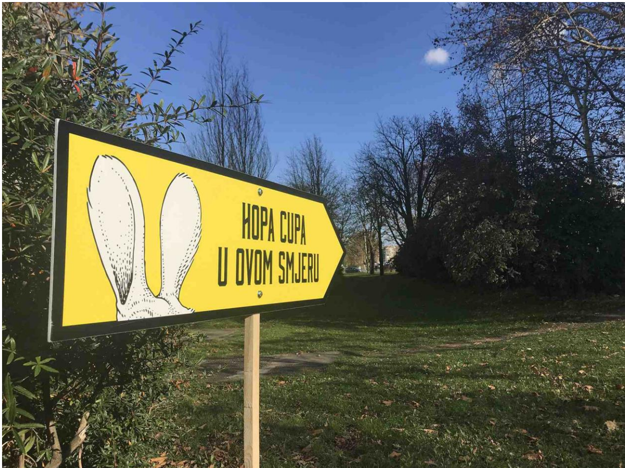
Slika 7: Primjer guerilla marketinga - Hopa Cupa by Heineken

Gerilski marketing je uvelike pomogao uvođenju novog pića na tržište koje je samo po sebi veliko. U kampanji su korišteni teaser plakati, zanimljive naljepnice i putokazi koji su uspjeli zaintrigirati svakog prolaznika. Postavljali su se na mjestima gdje dnevno prođe puno ljudi te su tako puno više i primijećeni. Prema tome postignut je efekt rasprostranjenosti i zbog svoje zaintrigiranosti uspjela se postići komunikacija „od usta do usta“. Kasnije se kampanja nastavila na društvenim mrežama.