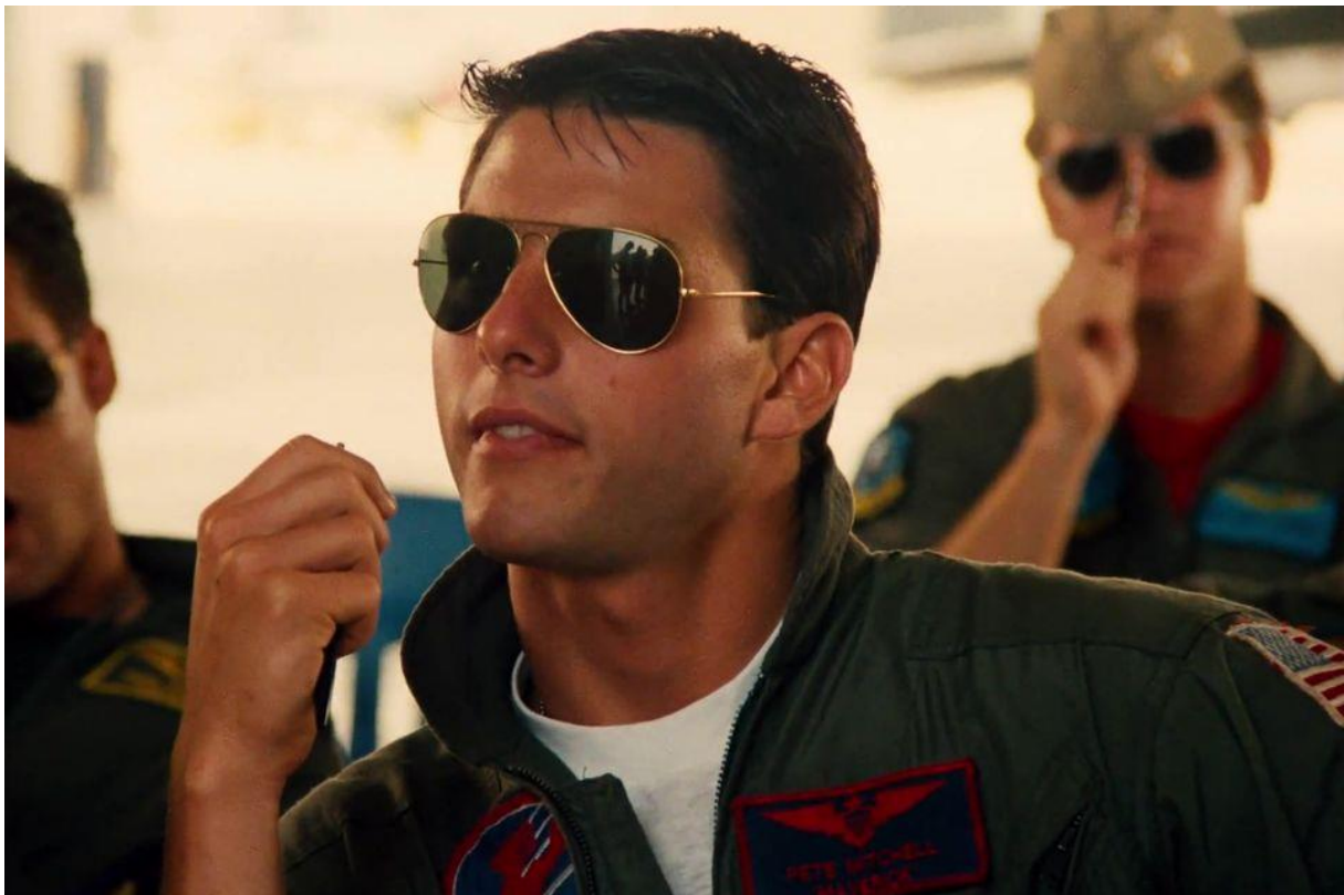
Slika 9: Primjer prikrivenog oglašavanja Top Gun - Ray Ban

Kada je riječ o prikrivenom oglašavanju u filmovima, specifično je da se proizvod ili usluga koji se oglašava, ujedinjuje u film (televizijska serija, program, tekst pjesme, videoigre itd.). Za primjer je uzet film Top Gun, gdje glumac Tom Cruise tokom filma nosi naočale vrlo poznatog brenda, Ray Ban.