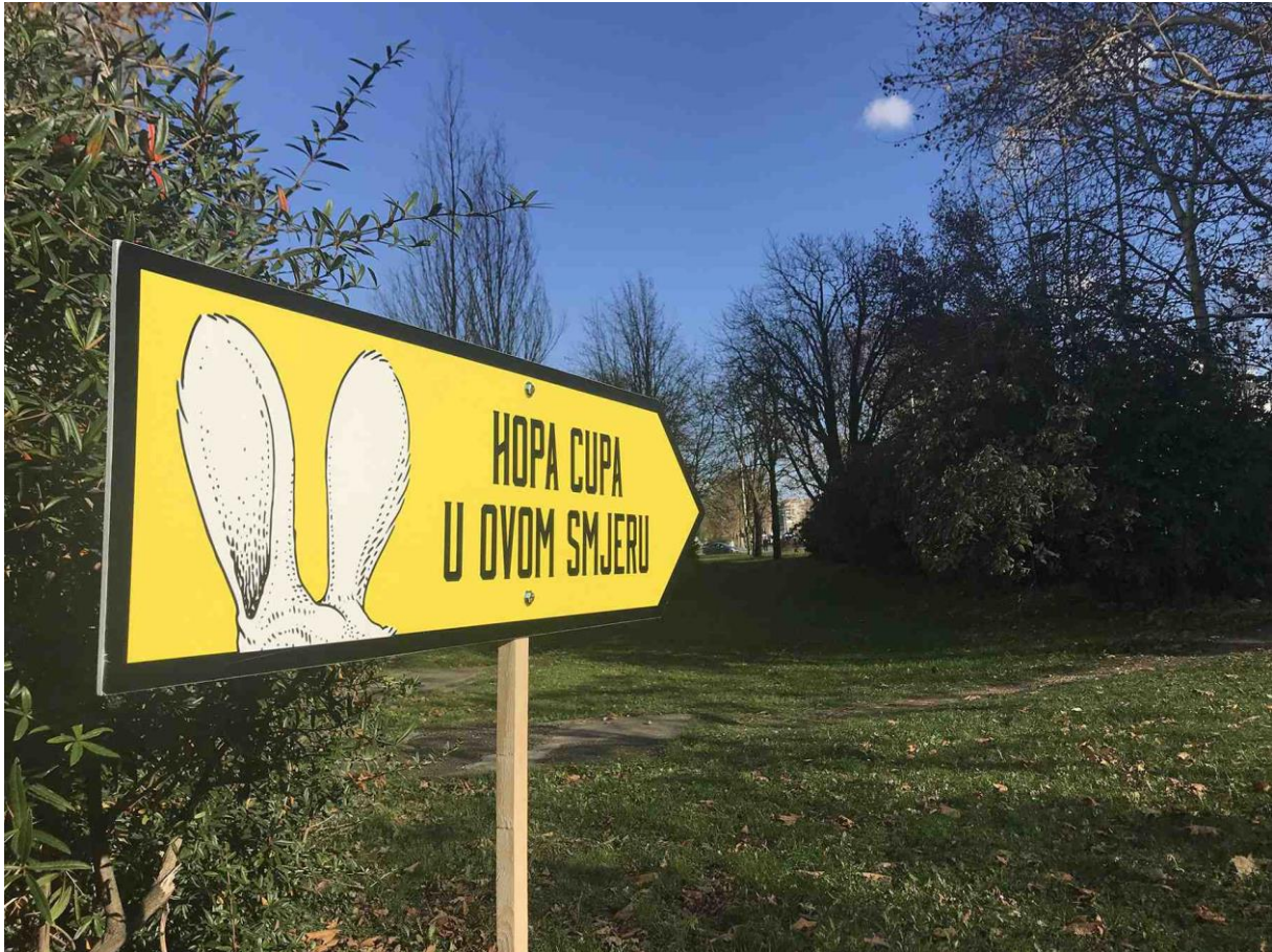
Slika 7: Primjer guerilla marketinga - Hopa Cupa by Heineken

Gerilski marketing je uvelike pomogao uvođenju novog pića na tržište koje je samo po sebi veliko. U kampanji su korišteni teaser plakati, zanimljive naljepnice i putokazi koji su uspjeli zaintrigirati svakog prolaznika. Postavljali su se na mjestima gdje dnevno prođe puno ljudi te su tako puno više i primijećeni. Prema tome postignut je efekt rasprostranjenosti i zbog svoje zaintrigiranosti uspjela se postići komunikacija „od usta do usta“. Kasnije se kampanja nastavila na društvenim mrežama.