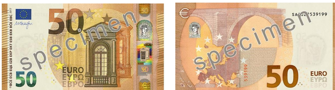
Slika 13 Novčanica od 50 €