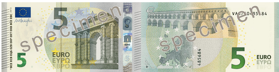
Slika 10 Novčanica od 5 €, ogledni primjerak

Seriya „Europa“ sastoji se od šest apoen: 5, 10, 20, 50, 100 i 200 eura. Razlika između te serije i prethodne je što ne sadrži apoen od 500 eura. Prema službenoj stranici Europske središnje banke, dizajni prikazuju arhitektonske stilove europske kulturne povijesti podijeljene na sedam razdoblja: klasično na 5 €, romaničko na 10 €, gotičko na 20 €, renesansa na 50 €, barok i rokoko na 100 €, doba željeza i stakla na 200 € te moderna arhitektura 20. stoljeća na 500 €. Sve novčanice prikazuju tipične elemente tih razdoblja, poput prozora, prolaza i mostova. Prozori i vrata na prednjoj strani simboliziraju europski duh otvorenosti i suradnje. 12 zvijezda EU predstavlja dinamiku i harmoniju suvremene Europe, dok mostovi na poleđini simboliziraju komunikaciju između građana Europe te između Europe i ostatka svijeta. Apoeni se također razlikuju u dimenzijama, te su manji apoeni usporedno manjih veličina.