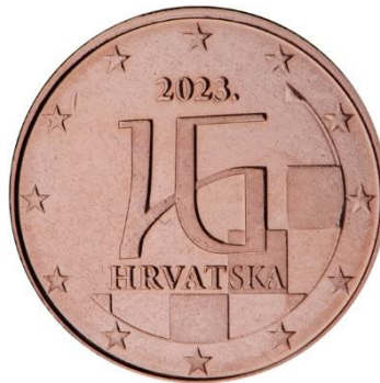
Slika 9 5, 2 i 1 cent, avers Republike Hrvatske.

Portret Nikole Tesle, izumitelja i inženjera koji je poznat po tome što je razvio tehnologiju izmjenične struje, nalazi se na desnoj polovici. Razlog zašto je odabran u kontekstu nacionalnog obilježja jest taj da je rođen i odrastao u Smiljanu, selu u Lici nedaleko od Gospića za vrijeme Vojne Krajine. Natpis „HRVATSKA“ vidljiv je u gornjem lijevom dijelu, motiv šahovnice je vidljiv u donjem lijevom. Kovanicu je dizajnirao Ivan Domagoj Račić. Ovaj dizajn aversa koristi se na kovanicama od 50, 20 i 10 centa.