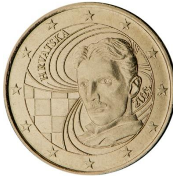
Slika 8 50, 20 i 10 centa, avers Republike Hrvatske.