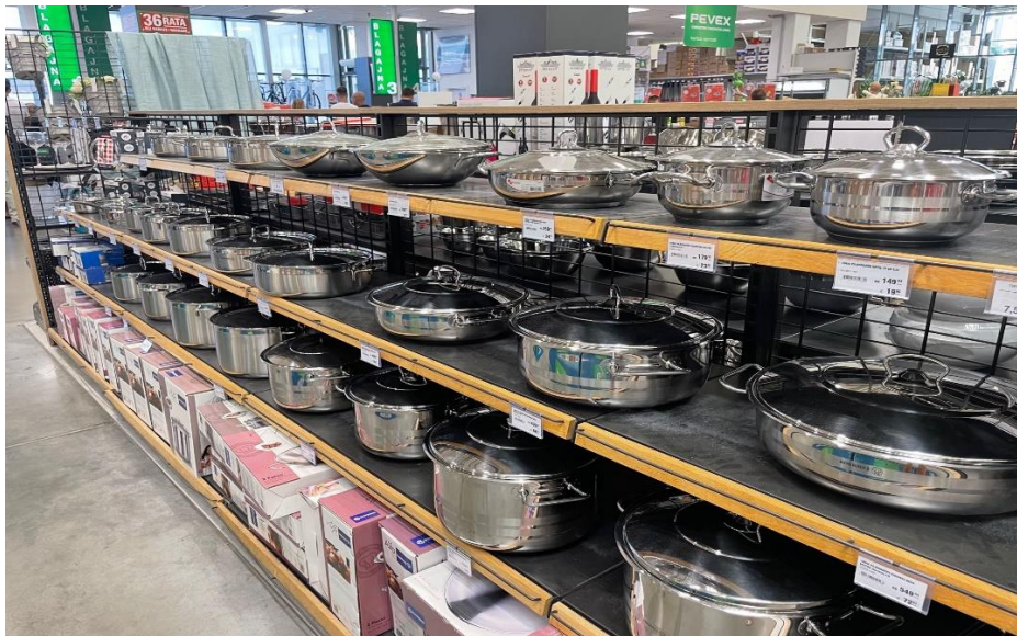
Slika 4 Uredno izloženi artikli