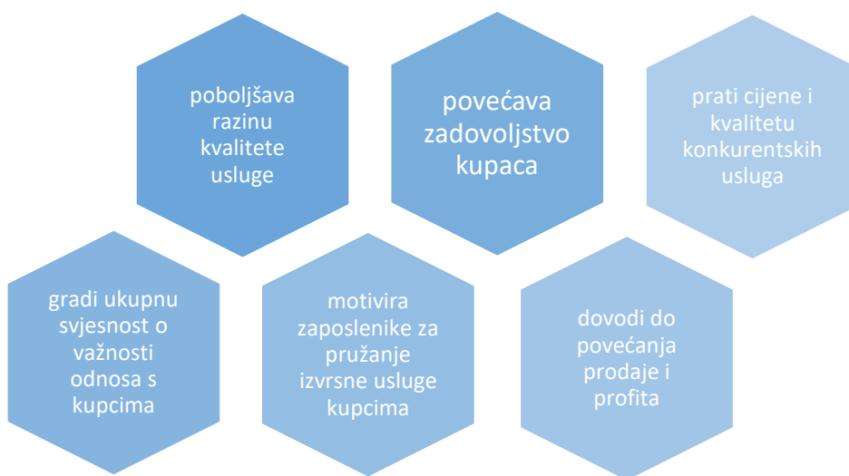
Dijagram 1. Prednosti mystery shoppinga (izrada autora prema Horbec, 2008.)

Mystery shopping je sve popularnija metoda koju tvrtke koriste kako bi unaprijedile kvalitetu svojih proizvoda i usluga. Ova tehnika omogućuje organizacijama dobivanje objektivnih i činjeničnih informacija o korisničkom iskustvu u interakciji s njihovim robnim markama. Prednosti tajne kupnje su brojne i pokrivaju sve aspekte poslovanja, kao što je prikazano na dijagramu u nastavku.