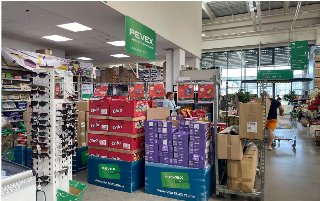
Slika 5 Istaknuti proizvodi uz popust s karticom vjernosti