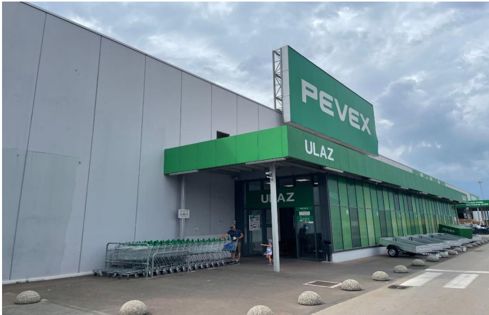
Slika 3 Vanjski izgled poslovnice

U nastavku su prikazane slike napravljene prilikom provedbe mystery shoppinga u Peveku koje prikazuju vanjski izgled poslovnice u datom trenutku, uredno izložene artikle te istaknute proizvode uz popust s karticom vjernosti.