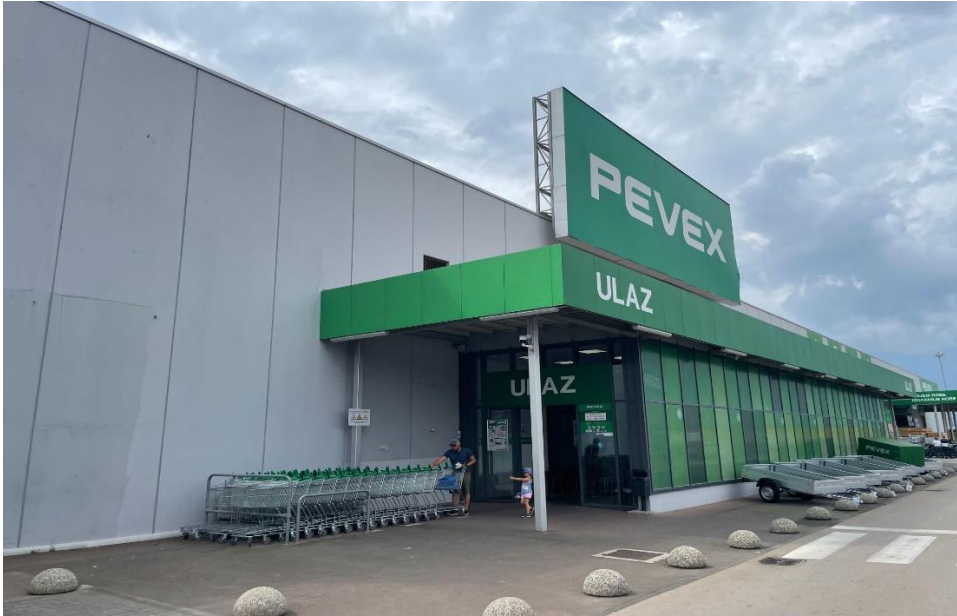
Slika 3 Vanjski izgled poslovnice (autor)

U nastavku su prikazane slike napravljene prilikom provedbe mystery shoppinga u Peveku koje prikazuju vanjski izgled poslovnice u datom trenutku, uredno izložene artikle te istaknute proizvode uz popust s karticom vjernosti.