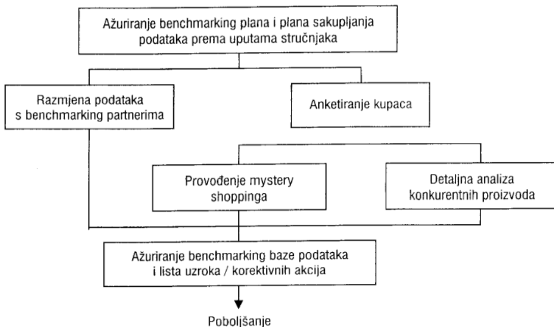
Slika 1 Prikaz tijeka dijagrama prikupljanja eksternih informacija temeljem originalnog istraživanja (Renko i Matošić, 2007:163)