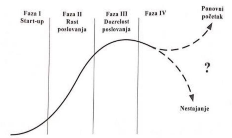
Slika 2. Faze životnog ciklusa obiteljskih poduzeća