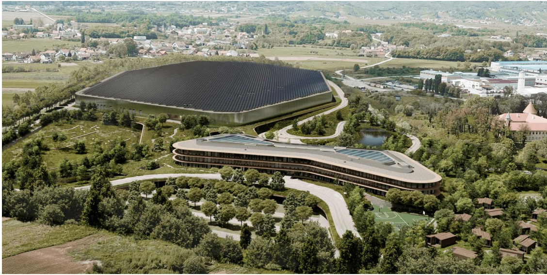
Slika 3. Pogon Rimac Automobila u Svetoj Nedelji

Rimac čvrsto je vjerovao da se električni pogonski sustavi mogu koristiti za pogon nove generacije sportskih automobila i učinit ih boljim, uzbudljivijim i bržim.