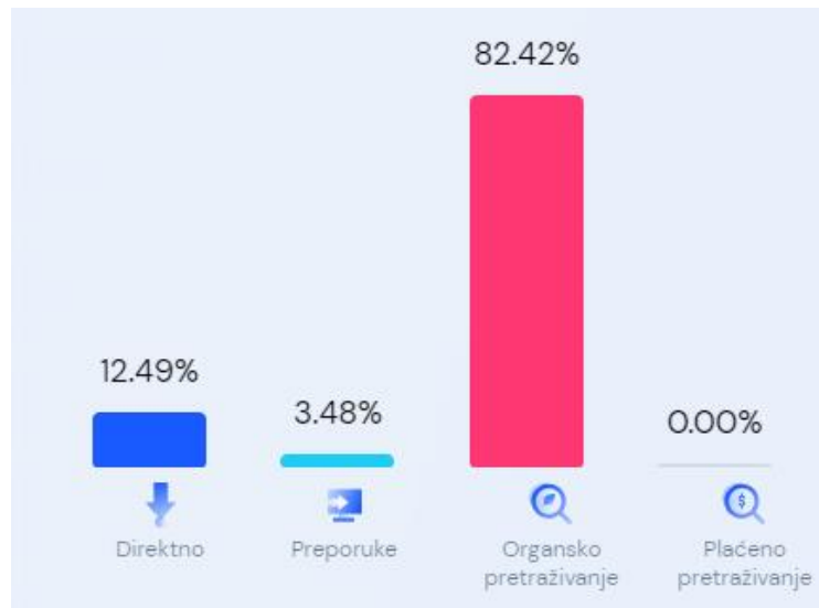
Slika 10. Distribucija marketinških kanala Rimac Automobila

Najveći izvor prometa je organsko pretraživanje (neplaćeni promet pretraživanja koji dolazi na web stranicu) na www.rimac-automobili.com , koji je doveo 82,42% posjeta stolnih računala mjesečno, a izravni je drugi s 12,49% prometa (Slika 10.).