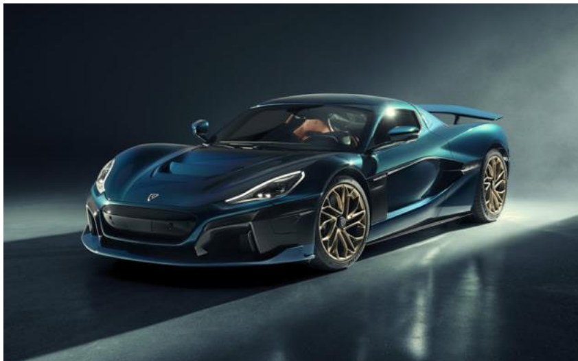
Slika 2. Dizajn Rimac Nevere

Rimac Automobili d.o.o. je hrvatski proizvođač automobila kojeg je 2001. godine osnovao Mate Rimac. Danas je tvrtka specijalizirana za 100% električne hiperautomobile. Dizajn Nevere (Slika 2.), hiperautomobila od 1900 konjskih snaga je značajan i doprinosi brendiranju tvrtke. Rimac planira proizvoditi četiri automobila mjesečno. Nije puno proizvoda, ali je s više od dva milijuna dolara po komadu prihod vrijedan divljenja. Tvrtka je doista pozicionirana u smjeru hiperinovacije, a ta se vrijednost dobro odražava na proizvodu. Usluga je personalizirana kao i sam proizvod. Svaki vlasnik Nevere pozvan je u Hrvatsku (gdje je Rimac sjedište) da dizajnira svoj automobil prema njegovim zahtjevima. Stoga se primjenjuju kodeksi prilagodbe kako bi korisničko iskustvo bilo optimalno i usklađeno s navikama bogatih kupaca.