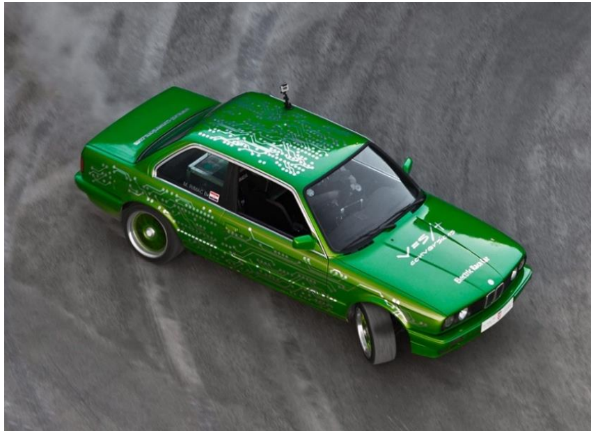
Slika 4. BMW- "Zeleno čudovište"

kako je to veliki uspjeh. Ne napredujemo možda toliko brzo koliko bismo željeli, ali sigurnim koracima gazimo naprijed. Naše poslovanje ne odnosi se samo na prodaju automobila, tu su i inženjerske usluge za druge tvrtke automobilske industrije i to je segment poslovanja koji trenutno donosi najviše prihoda, također bitno je napomenuti da prodajemo i električne bicikle. Naravno i narudžbe za sam automobil ne izostaju. Kupce ne možemo otkrivati, ali svi su izvan Hrvatske.“