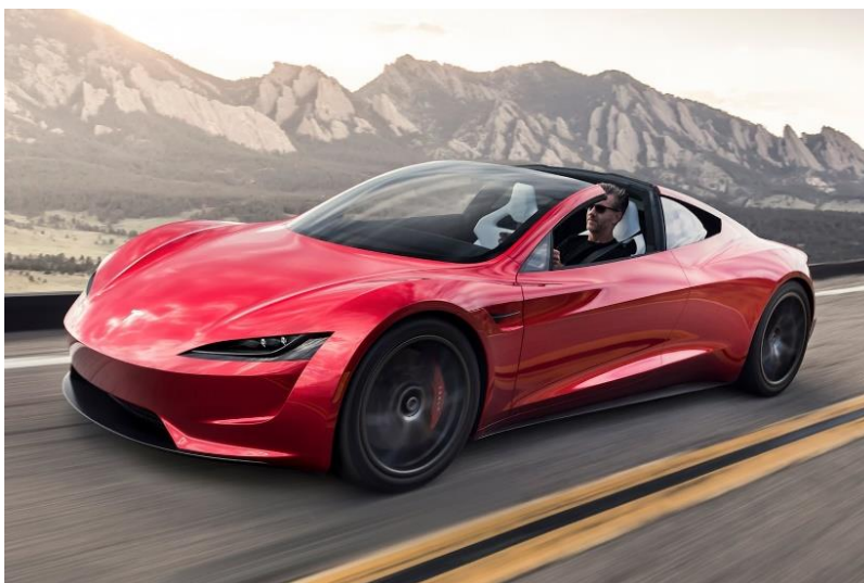
Slika 8. Tesla Roadster