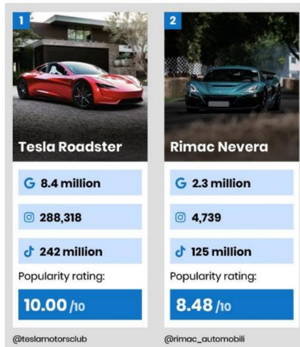
Slika 9. Usporedba popularnosti Tesle Roadstera i Rimac Nevere na društvenim mrežama