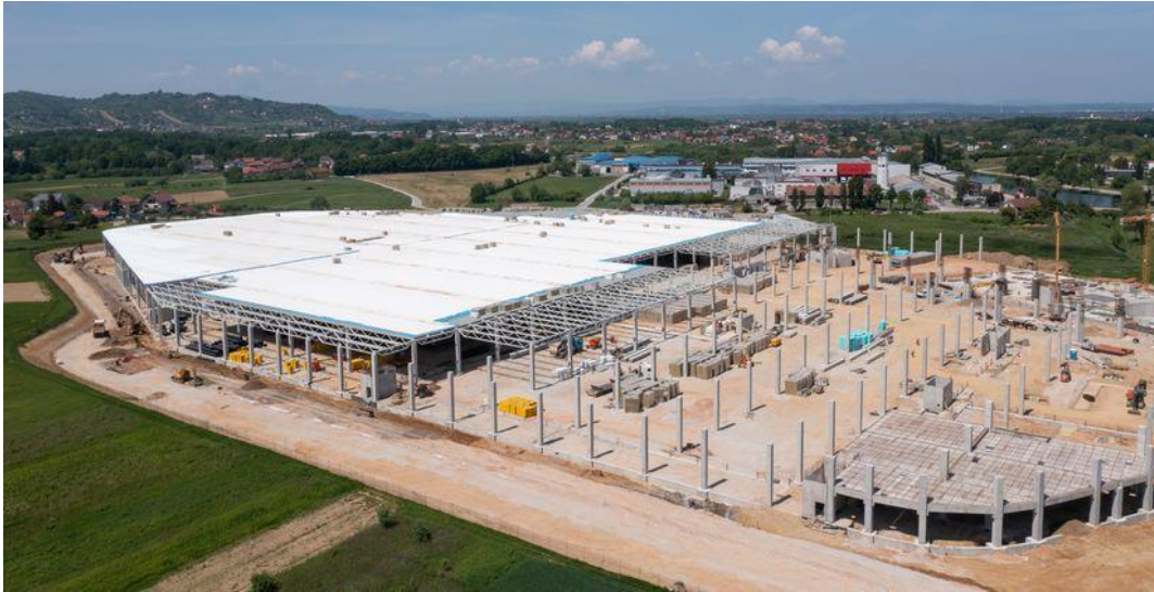
Slika 6. Gradnja Rimac Campus-a