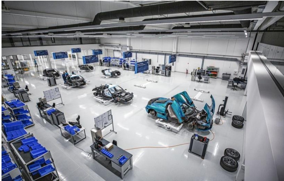
Slika 5. Proizvodni pogon Rimac Automobili d.o.o.

opreme (OEM) kroz projektiranje, inženjering i proizvodnju komponenti elektrificiranih vozila visokih performansi kao što su baterije i e-osovine. U studenom 2021. Rimac Automobili d.o.o. je također uspješno završio spajanje Rimčeve divizije hiperautomobila – Rimac Automobili – s Bugatti Automobiles. Oba brenda sada posluju pod tvrtkom Bugatti Rimac, vodećim svjetskim proizvođačem ultraluksuznih hiperautomobila visokih performansi.