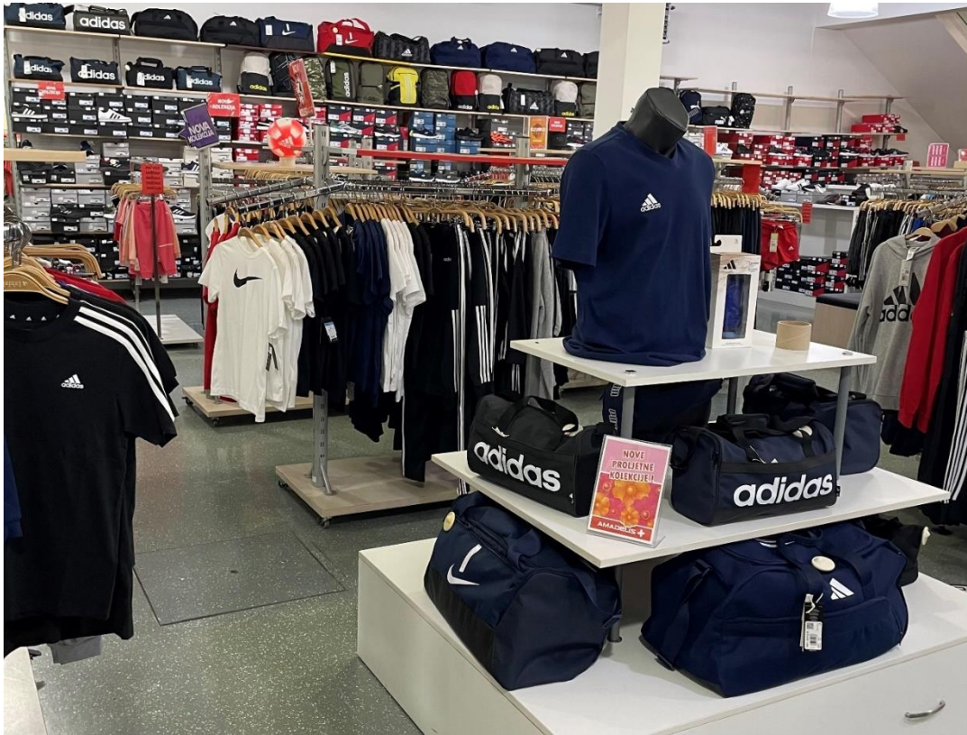
Slika 4: Asortiman u prodavaonici