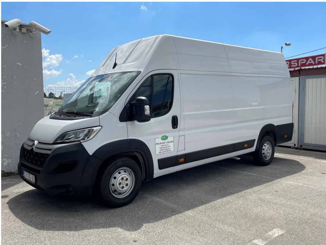
Slika 2. Transportno sredstvo tvrtke Amadeus Jukić d.o.o.

Iz tvrtke navode kako nemaju vlastitu proizvodnju nego da već sve proizvode koje imaju u ponudi su od strane raznih dobavljača. U samim počecima u prodavaonicama se mogla pronaći odjeća isključivo od traperera. Nakon što se to pokazalo uspješno tvrtka je u prodavaonicama proširila asortiman. Prvi uvozi su bili iz Turske te Italije. Istraživanjem tržišta tvrtka dolazi do spoznaje da je velika potražnja za sportskom odjećom najpopularnijih sportskih brandova, odlučuju u tom pravcu pronaći potencijalne kupce. Naposljetku, još su asortiman upotpunili uvozom od strane distributera iz Francuske i Mađarske. Trgovac navodi kako ima jedno registrirano vozilo kojim obavlja transport diljem prodavaonica te navodi poneki samostalni odlazak svojim vlastitim transportnim sredstvom (Slika 2) po robu u najbliže zemlje (Italiju i Mađarsku).