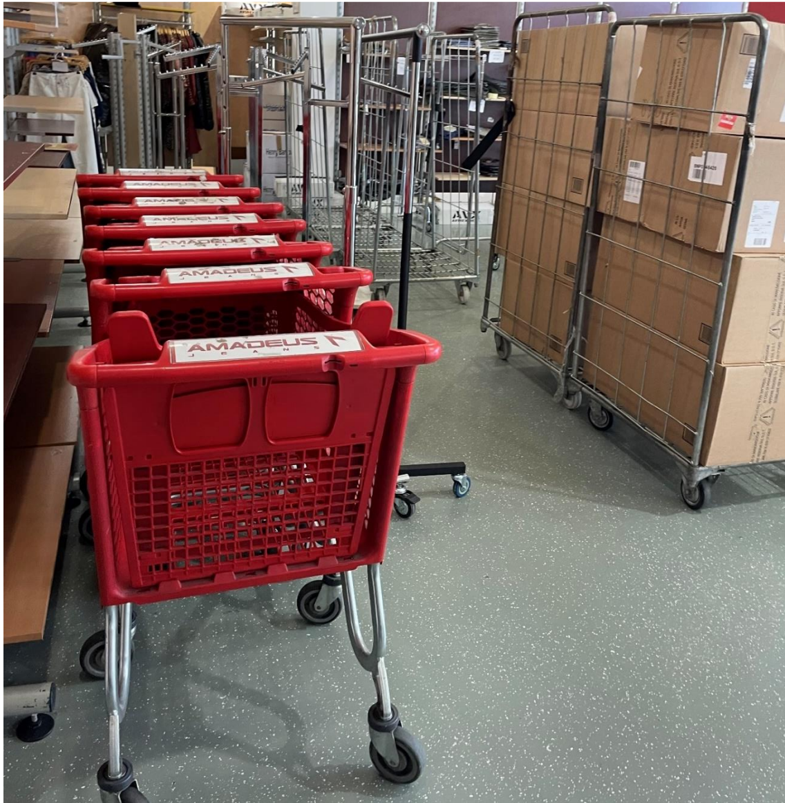
Slika 5. Transport unutar prodavaonice

kontejneri kojima se najviše služe za transport unutar skladišta i svladavanjem prostora u istome. Vješalice za odjeću su karakteristične kako u prodavaonici tako i u skladištu, iako roba u skladište dolazi u kutijama, nakon raspakiravanje kutija, roba se pregledava kako bi se utvrdila ispravnost i zatim se koriste vješalice za određenu robu dok se ostala roba slaže na police prodavaonice.