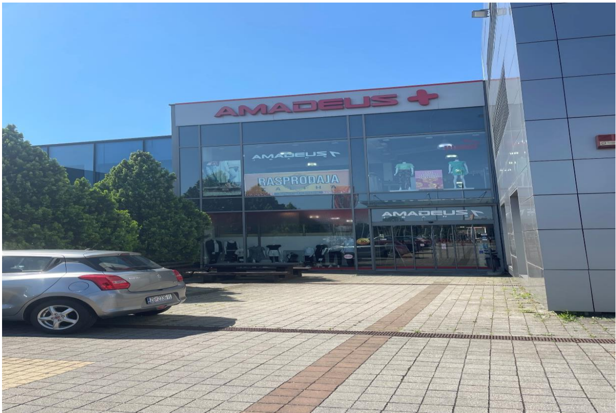
Slika 1. Sjedište tvrtke Amadeus Jukić d.o.o.

Za potrebe pisanja diplomskog rada proveden je intervju s voditeljem logistike tvrtke Amadeus Jukić d.o.o.. Prvi korak za istraživanje je bilo kontaktiranje vlasnika tvrtke te iznošenje ideje da se istraživanje provodi upravo na ovoj tvrtki. Nakon što je dobivena pozitivna povratna informacija sastavljen je intervju i dogovoren termin u posjećivanja. Odabrana prodavaonica za istraživanje je njihova najveća prodavaonica koja se nalazi u Zagrebu. Prodavaonica se proteže na dvije etaže. Na istoj lokaciji je i centralno skladište. Pod centralnim skladištem podrazumijeva se da ondje dolaze svi artikli koji su namijenjeni za sve prodavaonice, ondje se vrši komisioniranje te se artikli šalju u ostale prodavaonice diljem Hrvatske. Tvrtka trenutno zapošljava 50-ak djelatnika u 9 prodavaonica. Prodavaonice su smještene većinom u istočnoj Hrvatskoj, odnosno u Slavoniji dok je centralna prodavaonica i skladište u Zagrebu, to je ujedno i sjedište te je ondje tvrtka registrirana. Prilikom dolaska u promatranu prodavaonicu (Slika 1), koja se nalazi u Zagrebu, avenija Dubrava 264, može se uočiti moderan dizajn zgrade koja se nalazi u nizu zgrada. Ispred zgrade se nalaze parkirna mjesta za kupce.