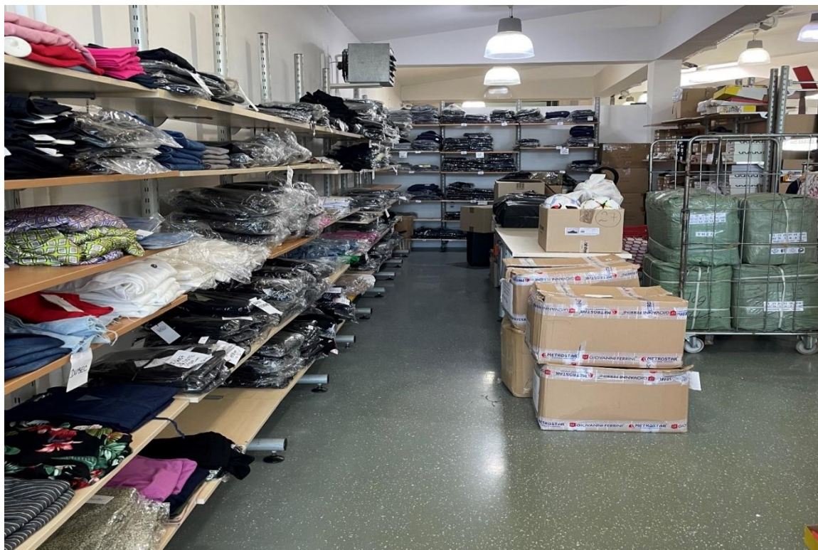
Slika 6. Skladišni prostor

Kako ne bi došlo do nedostatka artikala na policama subjekt koristi vlastitu aplikaciju kojom prati prodaju i potražnju. Navodi kako mu aplikacija znatno olakšava cjelokupan proces praćenja. Jedna od važnijih funkcija je praćenje dobavljača. Svaki dobavljač ima svoju šifru po kojoj trgovac prati ulaz robe, količinu koja je prodana i u kolikom vremenskom razmaku, maržu, postotak i sl.. Prethodno navedeno ukazuje na dobru organizaciju subjekta te u slučaju da je dobavljač u nemogućnosti dostaviti robu, subjekt na raspolaganju ima alternativnog dobavljača. Trgovac se s najvećim izazovima susreće na prijelazima sezonskih kolekcija. Najveći obujam posla predstavlja istraživanje novih trendova i mode. To je najizraženije u veljači i ožujku te srpnju i kolovozu. Nakon što se složi asortiman i nove kolekcije dolazi se do narudžbi. Trgovac ovdje navodi da mu je važno da dobavljač bude konstantan u smislu dolazaka, minimalno jednom tjedno. Na sljedećoj slici nalaze se artikli smješteni u skladištu (Slika 6) koji se premještaju u prodavaonicu nakon prodaje istog artikla, već prisutnog u prodavaonici.