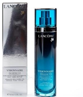
Slika 2. Lancôme Visionnaire serum za lice

Visionnaire LR2412 4% serum dolazi u elegantnoj, visokokvalitetnoj bočici oblika prizme, azurno plave i crne boje koja može sadržavati 30ml ili 50ml seruma za lice (slika 3.).