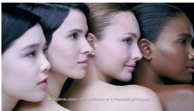
Slika 4. Primjer Lancôme reklamne kampanje