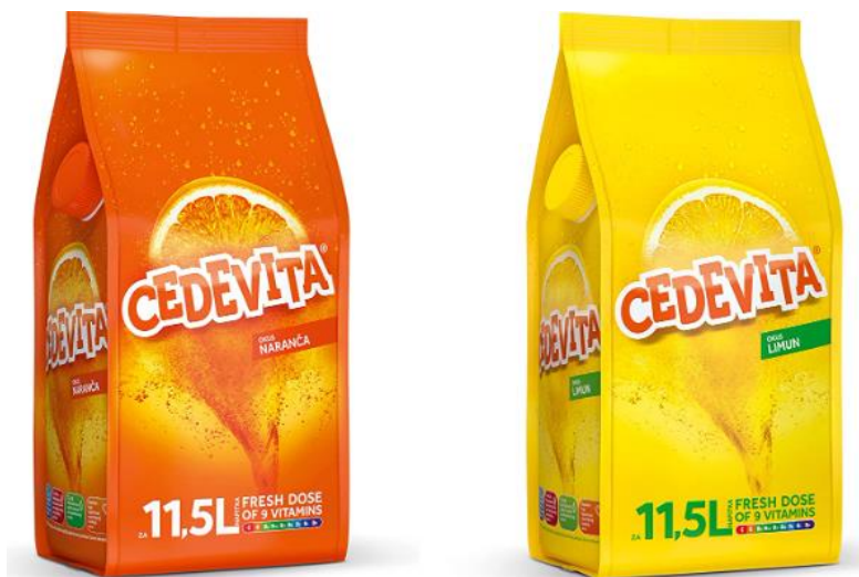
Slika 2: Logo Cedevite

Marka proizvoda predstavlja pojam, dizajn ili simbol koji služi za identifikaciju i prepoznatljivost proizvoda na tržištu. Na svim proizvodima Cedevite prisutan je narančasti logo, koji je ujednačen na svakom pakiranju, bez obzira na okus. Logo, prikazan na slici 2, uvijek je narančast, bilo da se radi o okusu naranče, limuna ili bilo kojem drugom. Narančasti logo odražava povijest Cedevite, budući da je Cedevita s okusom naranče bila prvi proizvod koji je lansiran i postao simbol brenda, stekavši značajnu lojalnost i tradiciju među potrošačima.