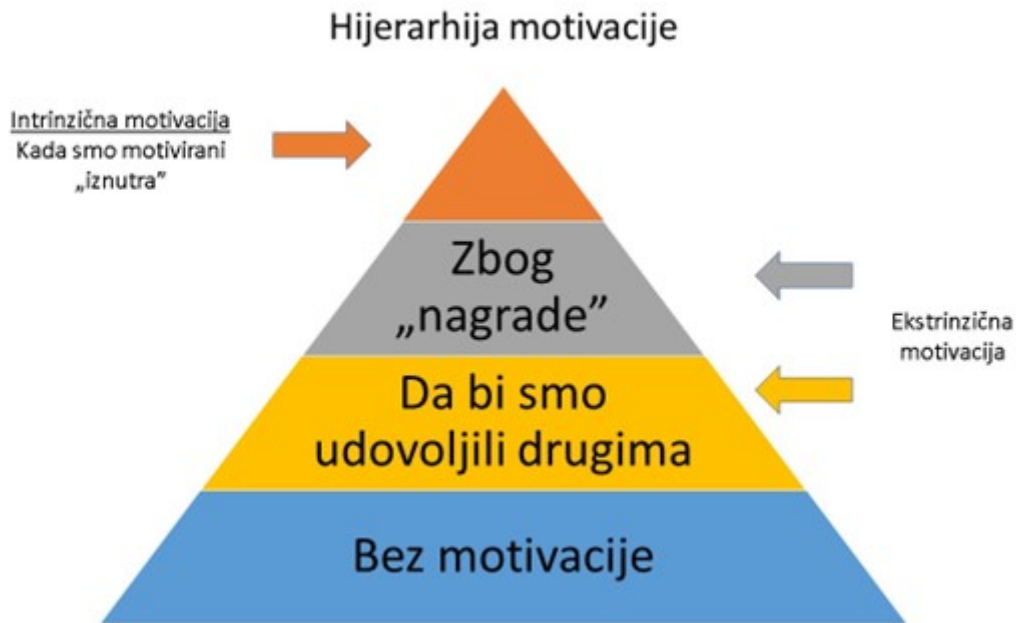
Slika 1: Hijerarhija motivacije, dostupno na: https://deepproject.hr/kako-motivirati-ljude-i-zasto-benefiti-ne-mogu-biti-jedina-motivacija/ [pristupljeno 20. svibnja 2024. ]

S druge strane, kod intrinzične ( unutarne) motivacije cilj je da motivacija pojedinca proizlazi iz njegovih unutarnjih želja i interesa. Pojedinci koji su motivirani na ovaj način obavljaju zadatke i aktivnosti zbog osobnog zadovoljstva koje im te aktivnosti i zadatci donose, a ne zbog nagrada i kazni koje iz njih slijede. Upravo zbog toga intrinzična (unutarnja) motivacija često dovodi do veće kreativnosti, boljeg učenja te općenito većeg i dugoročnijeg zadovoljstva kod pojedinaca jer rade ono što vole i što ih najviše ispunjava.