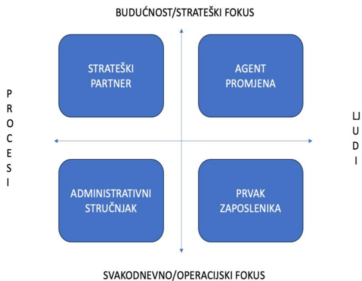
Slika 2 Model uloga D. Ulrich-a