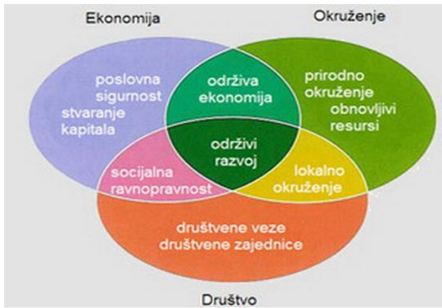
Slika 1. Čimbenici održivog razvoja