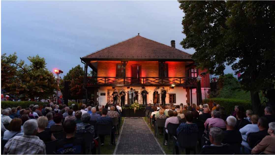
Slika 3. Festival Šokačke pisme u parku Zavičajnog muzeja Stjepana Grubera.