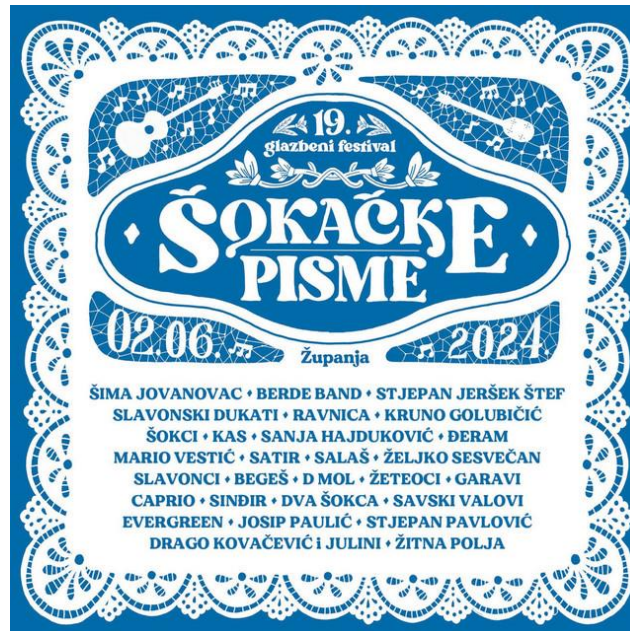
Slika 4. Popis izvođača na 19. festivalu Šokačke pisme u Županji

tamburaške glazbe. Na festivalu uz manje poznate (lokalne) sastave, sudjeluju i najpopularniji izvođači šokačke glazbe. Neki od njih su Stjepan Jeršek Štef, Šima Jovanovac i Mario Vestić. Popis izvođača 19. izdanja Festivala prikazan je promotivnim materijalom i vizualnim identitetom događanja (Slika 4).