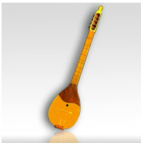
Slika 2. Tambura samica

Tambura ili tamburica tradicionalni je hrvatski instrument koji pripada skupini žičanih glazbala. Kao solistički instrument, tambura samica je preteča razvoju svih ostalih tambura (Slika 2).