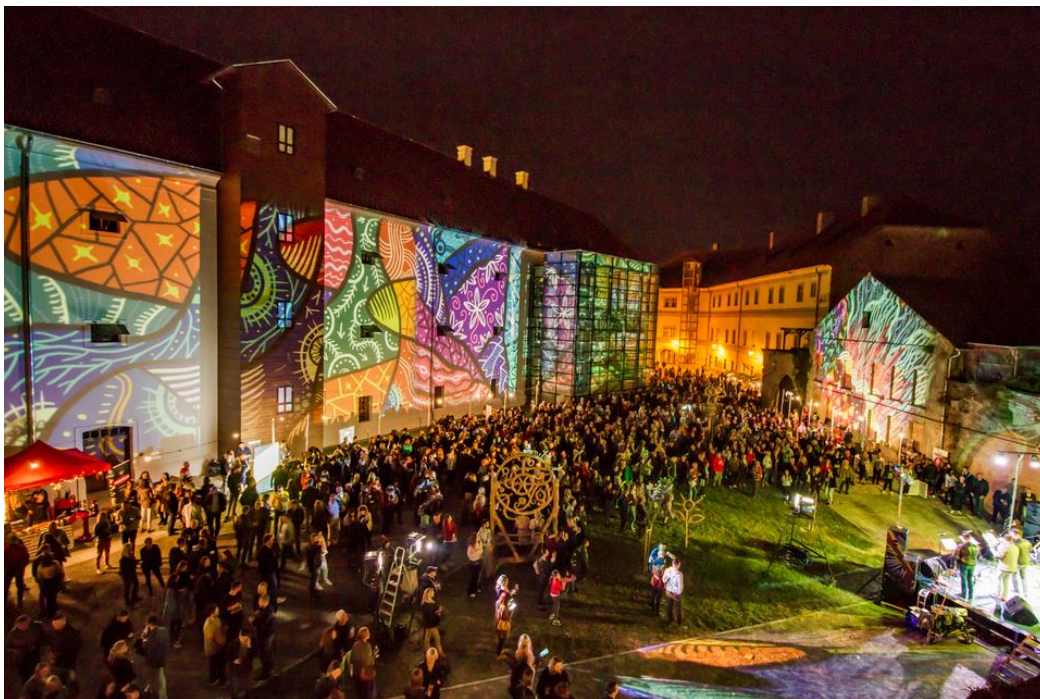
Slika 1. Vizualni efekti na festivalu HeadOnEast u Osijeku

Većina današnjih festivala podrazumijeva i vizualne efekte poput projekcije slika, video uradaka, prezentacija i slično (Slika 1.).