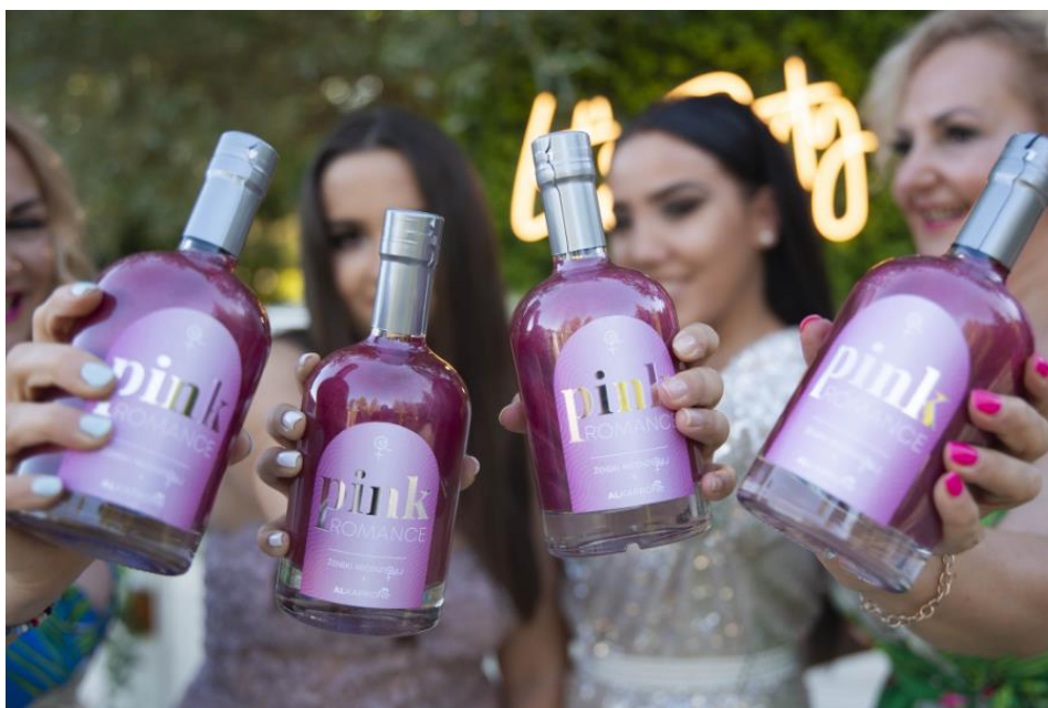
Slika 2. Voćni liker Pink Romance