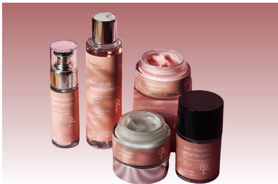
Slika 3. Linija kozmetike Skin Romance