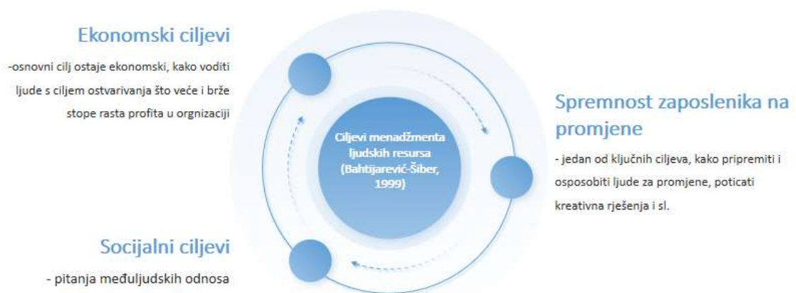
Slika 1. Ciljevi menadžmenta ljudskih resursa