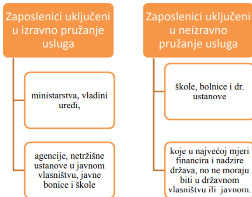
Slika 1. Prikaz javnog sektora