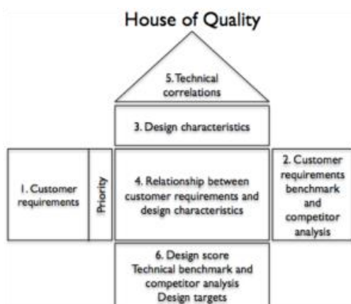
Slika 2. – šest koraka „kuće kvaliete“

Lazibat (2023) navodi da primjermom metode QFD, praktičari mogu uspostaviti vezu s kupcem i njihovim potrebama. Opis uloge kvalitete unutar organizacije često se obavlja putem zajedničkog sastanka vođa marketinga, dizajna i proizvodnje. Ključne funkcije analize QFD-a sumjerene su na razvoj proizvoda, upravljanje kvalitetom i analizom zahtjeva kupaca. QFD je metodologija koja osigurava da su zahtjevi kupaca ispunjeni tijekom dizajniranja proizvoda i proizvodnog procesa. To je i alat za komunikaciju i planiranje prije zadovoljavanja zahtjeva kupaca. Ključna prednost ove metode je poboljšanje komunikacije među funkcijama uključenih u stvaranje novih proizvoda, što dovodi do bržeg razvoja proizvoda i zadovoljstva kupaca.