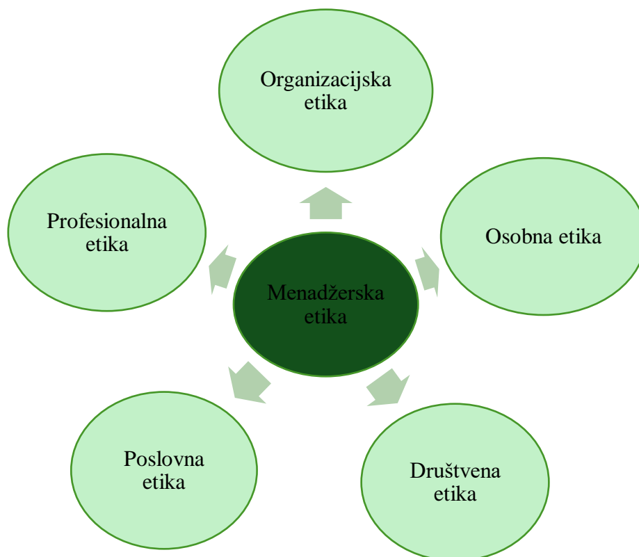
Slika 5 Determinante menadžerske etike