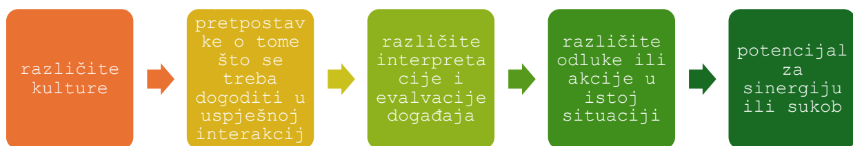
Slika 2 Potencijalni rezultat susreta različitih kultura