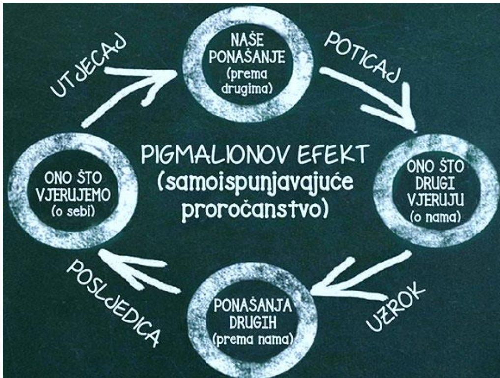
Slika 6 Pigmalionov efekt

ponašanje te se zahvaljujući očekivanjima želja i ispunila. Galatea efekt predstavlja visoka očekivanja i vjeru pojedinca te ih ono vodi ka uspjehu. Ukoliko imamo pozitivna očekivanja od nekog, ono može pozitivno utjecati na njihovo ponašanje, ali jednako tako možemo pretpostaviti kako niska očekivanja od pojedinaca mogu dovesti do njihove slabe učinkovitosti. Taj fenomen poznat je kao Golemov efekt. Golem je biće koje je trebalo iskorijeniti zlo, ali što je više raslo postalo je veće zlo.