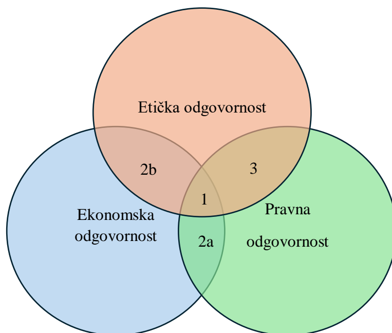
Slika 4 Vennov dijagram