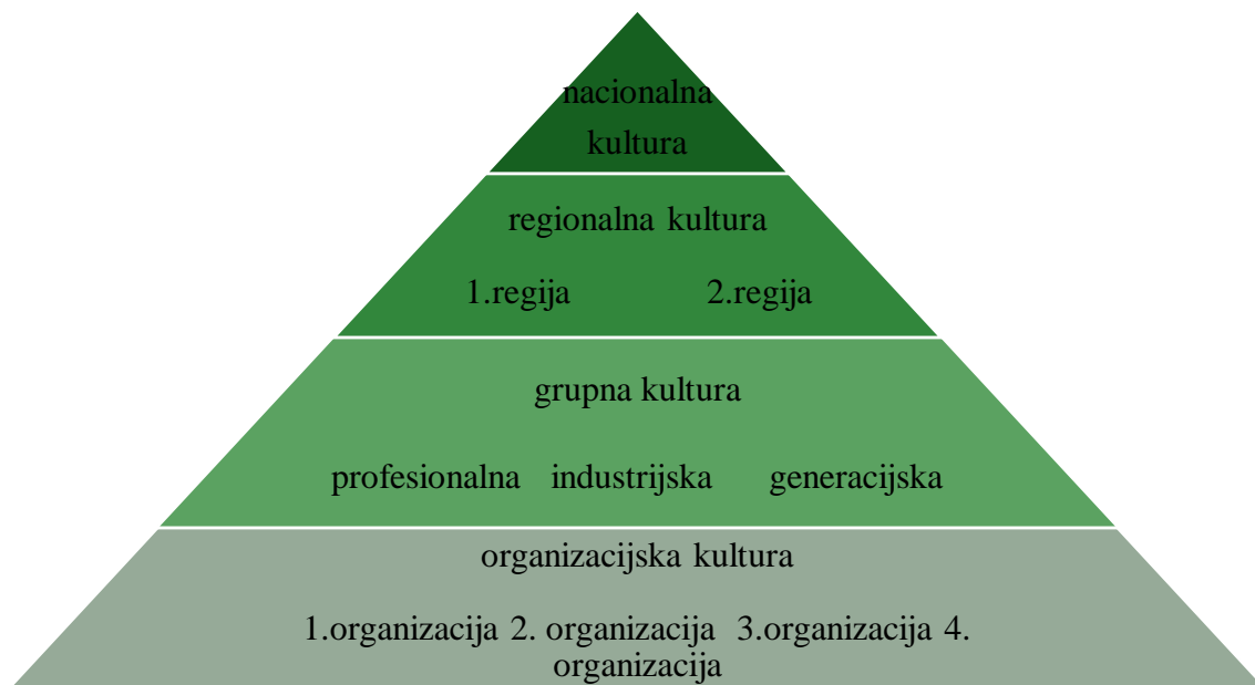
Slika 1 Razine kulture društva