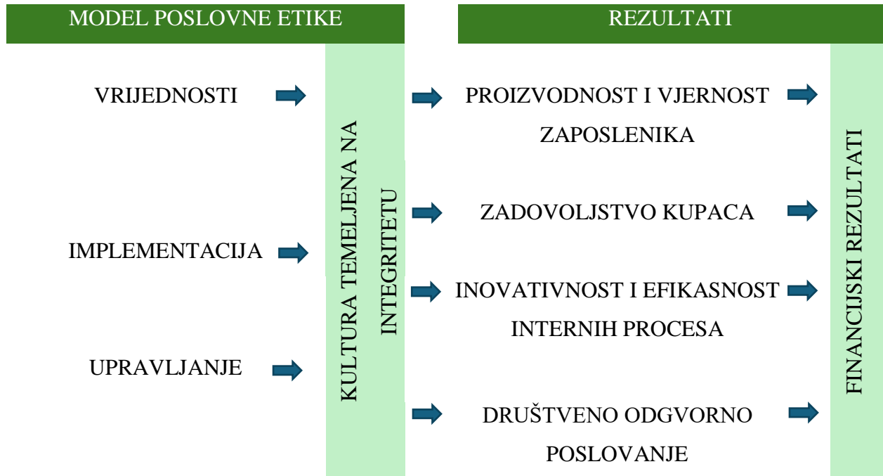
Tablica 3 Izravan i neizravan utjecaj poslovne etike na uspješnost poslovanja

zadovoljstvo kupaca, inovativnost i društveno odgovorno poslovanje, te oni neizravno utječu na financijske rezultate poslovanja organizacije (Tablica 3).