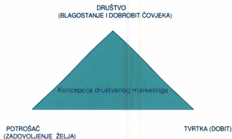
Slika 3. Koncepcija društvenog marketinga (Osnove marketinga, 2005.)

Koncepcija društvenog marketinga smatra da je „zadatak organizacije određivanje potrebe, želja i interesa ciljnih tržišta te ispunjenje željenog zadovoljstva efikasnije i učinkovitije od konkurencije i to na način kojim se štiti odnosno poboljšava ukupni boljitak potrošača i cjelokupnog društva.“ (Kotler, 2001.)