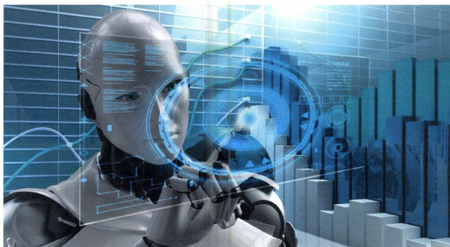
Slika 7. Umjetna inteligencija (Geek, 2019.)

„Umjetna inteligencija će gurati automatizaciju što je poplava koja se očekuje da će promijeniti cijeli svijet. Niti jedna industrija, tržište, regija ili sustav neće je moći izbjeći jer automatizacija utječe praktički na svaki aspekt života. To će promijeniti proizvodnju, servisnu industriju, hranu, piće, svjetske financije i naravno – kompjutersku industriju. Na primjer, jedna od mnogih stvari gdje se automatizacija koristi skupa sa neuralnim mrežama je generiranje klikova i posjećenosti za web stranice.“ (Tibor Z., 2018.)