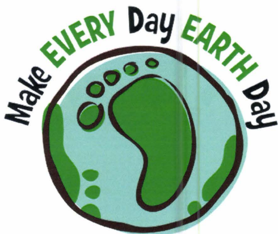
Slika 9. Dan planete Zemlje (Diva L., 2013.)

Edukacija predstavlja glavni temelj za napredak i zadatak urbanog marketinga u sintezi sa urbanom ekologijom. Zadatak se odnosi na stvaranju globalne slike o opasnostima koje nam prijete, tj. globalno stvaranje svijesti o ovome problemu. Urbani marketing i urbana ekologija zajedno donose sustav koji će educirati i poticati na rješavanje problema. Ona također ostavlja prostor za djelovanje u kojemu je svaki čovjek jednako odgovoran za svoje djelovanje prema ekosustavu.