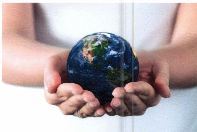
Slika 5. Društveno odgovorno poslovanje (24 sata, 2019.)

U naslovu ovog završnog rada ekologija nosi pola priče, stoga treba pojasniti ekologiju vezanu za čovjeka i okoliš u kojem živi. Ekologija čovjeka se najprije bavi proučavanjem odnosa čovjeka prema okolišu. Danas je ova tema sve više popularna iz razloga što je čovjek najveći zagađivač i onečišćivač prirode, a što u krajnjoj liniji ugrožava opstanak čovjeka. Onečišćenje i devastiranje okoliša šteti zdravlju čovjeka i svih živih bića koji žive u ekosustavu. Danas, kada je uvelike prisutna demografska ekspanzija tj. stanovništvo bilježi snažan porast, biosfera svakim danom biva sve zagađenija. Iz navedenih razloga početkom 90-tih započinje nova ideja o održivosti urbanog razvoja kao novi etičko-ekološki problem ili kontinuirani proces koji održava dijalektički odnos između ekonomije, društva, politike i okoliša. U tim procesima urbane ekologije bitan je urbani marketing.