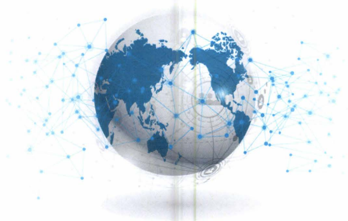
Slika 6. Globalizacija (PGS, 2019.)

Marketing u svijetu počinje imati sve veći značaj, jedan razlog koji doprinosi tome je i proces globalizacije koji počiva prije svega na političkim, ekonomskim, ali i kulturnim načelima. Poznato je da globalizacija omogućava brzi razvoj na području transporta i komunikacija koji je pokrenut željom velikih korporacija i gigantskih tvrtki za osvajanje novih svjetskih tržišta. Globalizacija u velikoj mjeri izaziva promjene u političkom, ekonomskom i kulturnom pogledu. Takva slika se najviše može vidjeti u gradovima gdje obitava čovjek. Ukratko rečeno, globalizacija nije ništa drugo već utrka za resursima, proizvodnjom i prodajom koja rezultira osvajanjem novih tržišta. Rezultat toga su također i velike promjene na tržištima. Moguće su pogreške i krive procjene u pogledu marketinga što može biti jako opasno za tvrtku, poduzeće ili organizaciju koja izlazi na svjetsko tržište. Na marketingu koji je u fokusu zbivanja kada je u pitanju prognoza i rizik tržišta nameću se sve veći izazovi, a neki od njih su stvaranje i kreiranje novih koncepata i ideja kako bi se premostile brze i ne predviđene prepreke koje donosi novo tržište zajedno sa globalizacijom.