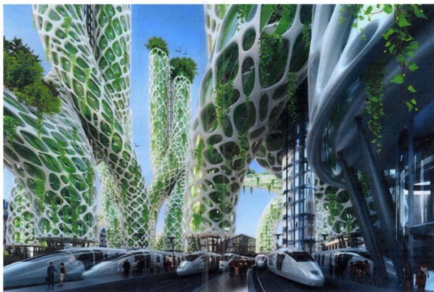
Slika 8. Planinski tornjevi u Rue de Rivoli (Dizajn doma, 2017.)

„Širom čitavog svijeta danas možemo vidjeti uspješne inicijative koje su poduzete na temu Pametnog grada. Ali, ono što možemo očekivati od francuske tvrtke Vincent Callebaut Architectures, odnosno ono što možemo vidjeti iz njihovih planova za Pariz je nešto do sada neviđeno. Iako ćemo morati čekati do 2050. godine, isplatit će nam se, jer će po gotovim radovima francuska prijestolnica biti pravi raj pametne arhitekture. Prateći Klimatski Energetski Plan Pariza s ciljem smanjivanja 75% efekta staklenika i emisija štetnih plinova do 2050. godine, Paris Smart City je projekt koji uključuje istraživanje i razvoj integracije visokih građevina s plus-energy sustavom koji proizvodi energiju za okolna područja. Kako bi se borili protiv fenomena urbanog toplog otoka, podižući istodobno gustoću naseljenosti grada na daleke staze, ova studija prikazuje nam osam tipova mješovitih tornjeva. Tornjevi nam predstavljaju povratak prirode u samo srce grada i integriranu formu njihovog dizajna i pravila bioklimatizma, kao i obnovljive i reciklirajuće energije u inovativnim sustavima. Kako bi se okrenuli novim socijalnim inovacijama, oni su predstavili nove eko-odgovorne načine života, koji će podići kvalitetu života u gradovima, uz neprikosnoveno poštovanje prema prirodnoj sredini“. (P.Ć., 2017.)