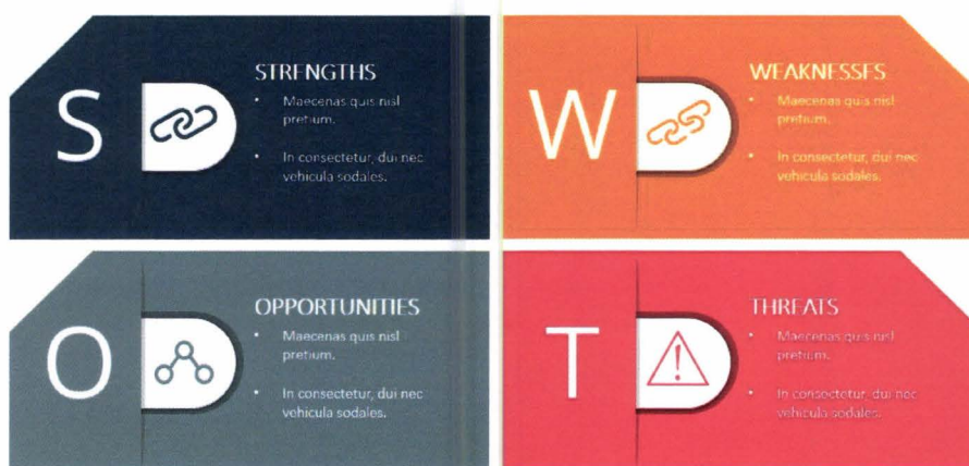
Slika 4. SWOT analiza (SlideModel, 2019.)

Slika 4. prikazuje objašnjenje za svako pojedino slovo u riječi „SWOT“. Značenje svakog pojedinog slova na engleskom jeziku: S - (eng. Strengths) - snaga, W- (eng. Weaknesses) - slabosti, O- (eng. Opportunities) - prilike, T- (eng. Threats) - prijetnje.