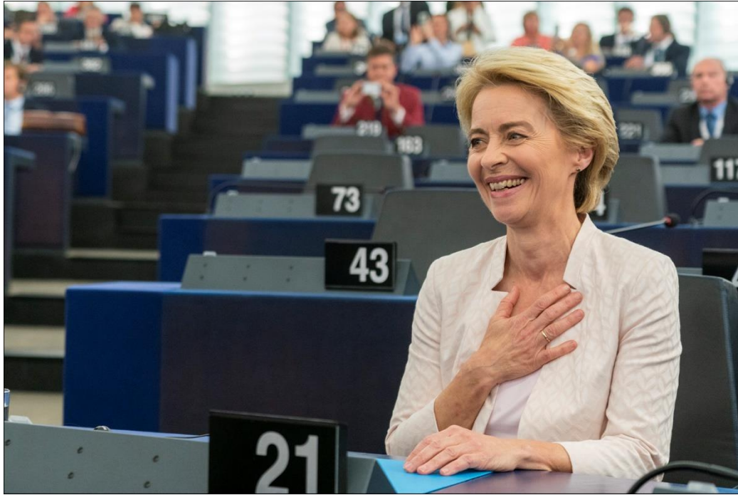
Slika 1. Ursula von der Leyen [pristupljeno 14.6.2020.]