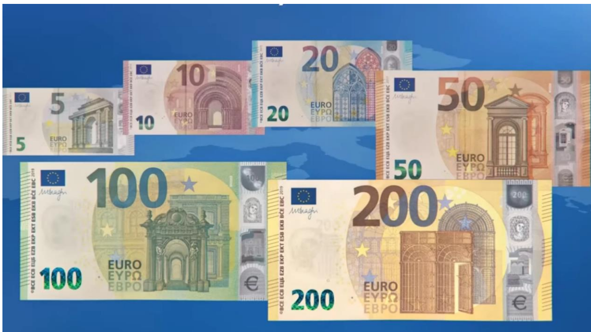
Slika 4. Novčanice eura [pristupljeno 14.6.2020.]

Prema publikaciji Europske komisije Euro (€) dijeli 19 članica od ukupno 28 i jedinstvena je za Europsku Uniju. U početku se koristio samo za bezgotovinsko plaćanje, a od 2002. godine su izdane prve novčanice i kovanice koje se koriste za sva plaćanja. Euro se u pojedinu državu članicu uvodi tek ispunjenjem određenih kriterija koji su propisani ugovorom iz Maastrichta, a odnose se na stabilnost cijena, javne financije, tečaj i dugoročne kamatne stope. „Država članica EU-a mora dobiti pozitivnu ocjenu institucija EU-a – Europske središnje banke i Europske komisije – o ispunjavanju kriterija i spremnosti za nesmetano funkcioniranje u monetarnoj uniji. Jedan od kriterija – onaj o stabilnosti tečaja, koji podrazumijeva da nacionalna valuta države članice sudjeluje u tečajnom mehanizmu ERM II bez poremećaja i velikih oscilacija tečaja u odnosu na euro najmanje dvije godine – uvjetuje ukupnu dinamiku procesa uvođenja eura.“ (Hrvatska narodna banka, mrežno izdanje, 2017.)