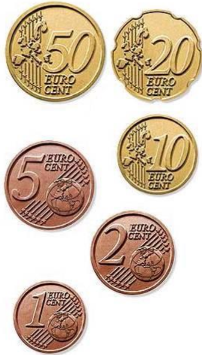
Slika 5. Kovanice eura