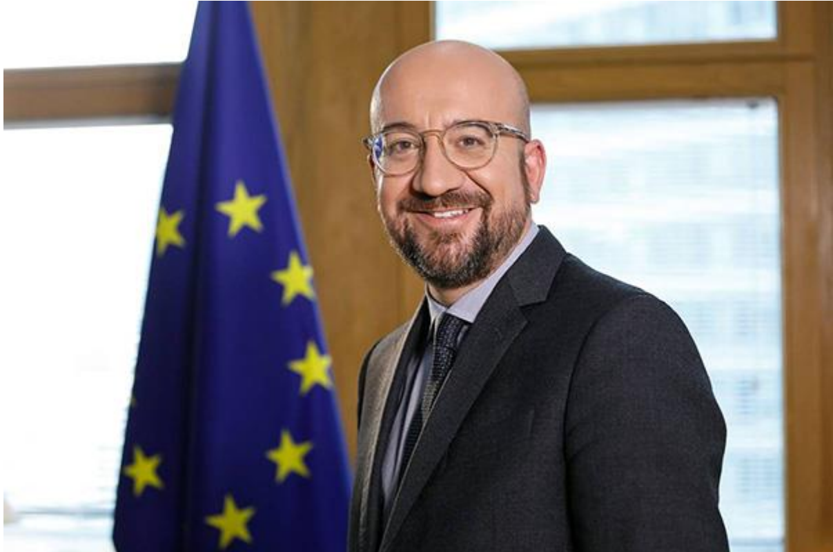
Slika 3. Charles Michel ( https://www.consilium.europa.eu/hr/european-council/ ) [pristupljeno 14.6.2020.]