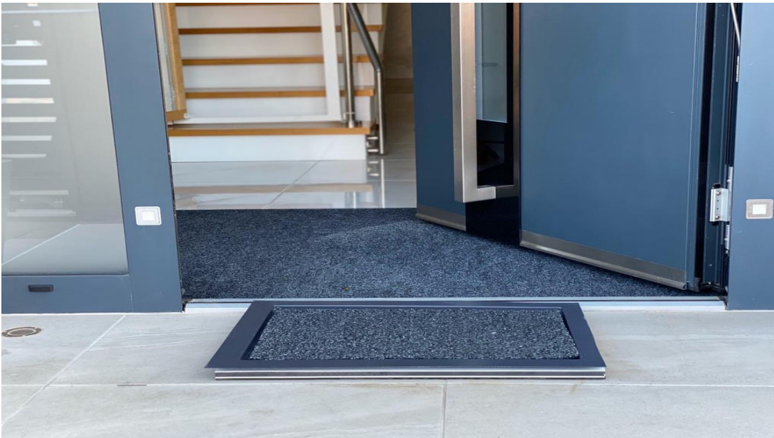
Slika 2. - Dezinfekcijska barijera za obuću