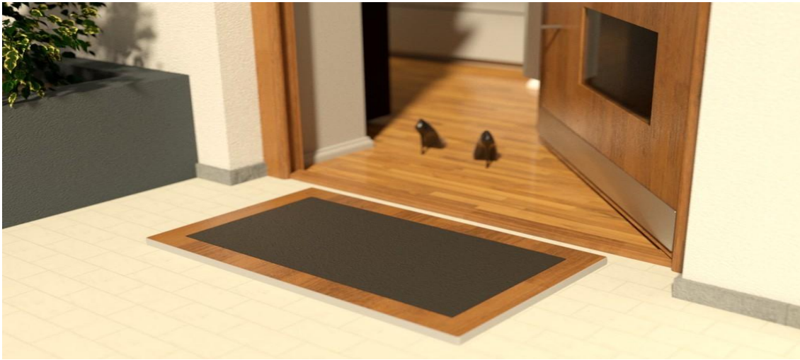
Slika 1. - Dezinfekcijska barijera za obuću