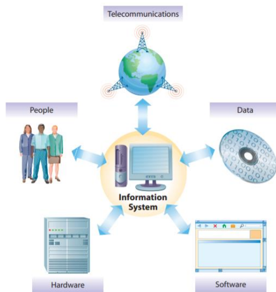
Slika 1: Informacijski sustav se sastoji od 5 ključnih elemenata: hardware, software, data, people, telecommunications.