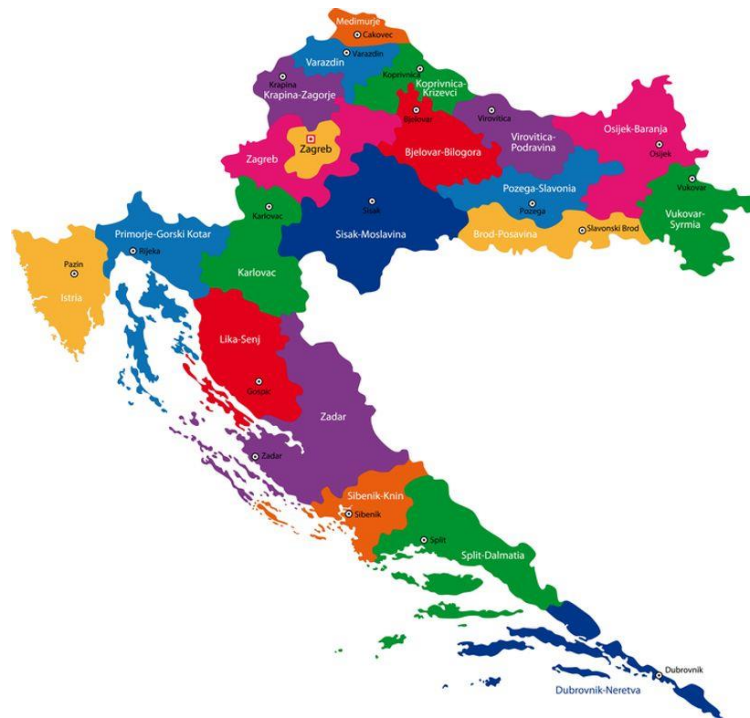
Slika 2 Podjela Republike Hrvatske po županijama i županijskim središtima