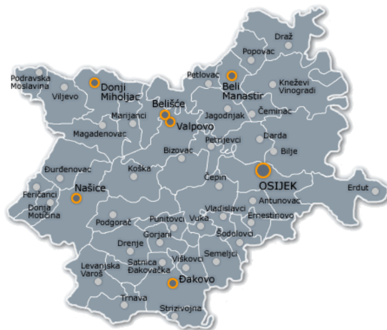
Slika 4 Podjela Osječko - baranjske županije na općine sa istaknutim gradovima