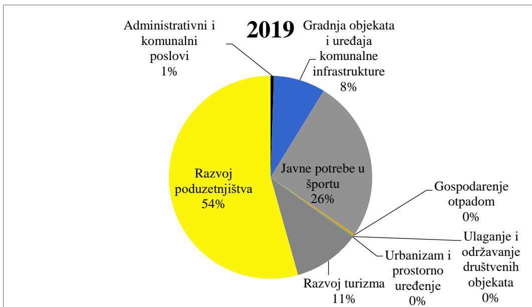
Graf 2. Prikaz omjera iznosa koji su uloženi u razvojne programe općine Antunovac