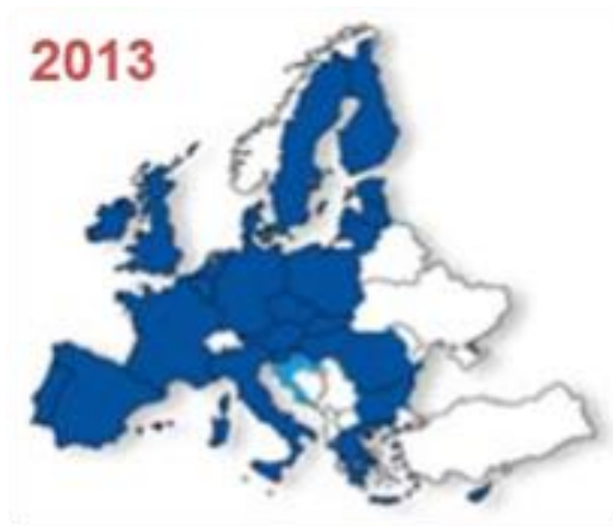
Slika 2. Pristupanje Republike Hrvatske Europskoj uniji

Izvor: ClosEUp (Europa izbliza), dostupno na: https://www.closeup-filmfestival.eu/wp-content/uploads/2014/11/2013.png