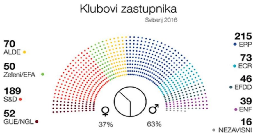
Slika 5. Klubovi zastupnika