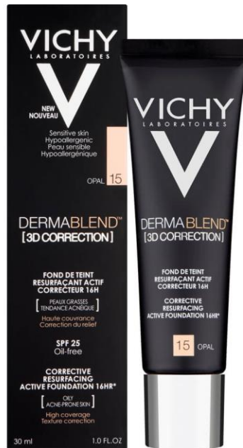
Slika 2 Dermablend puder