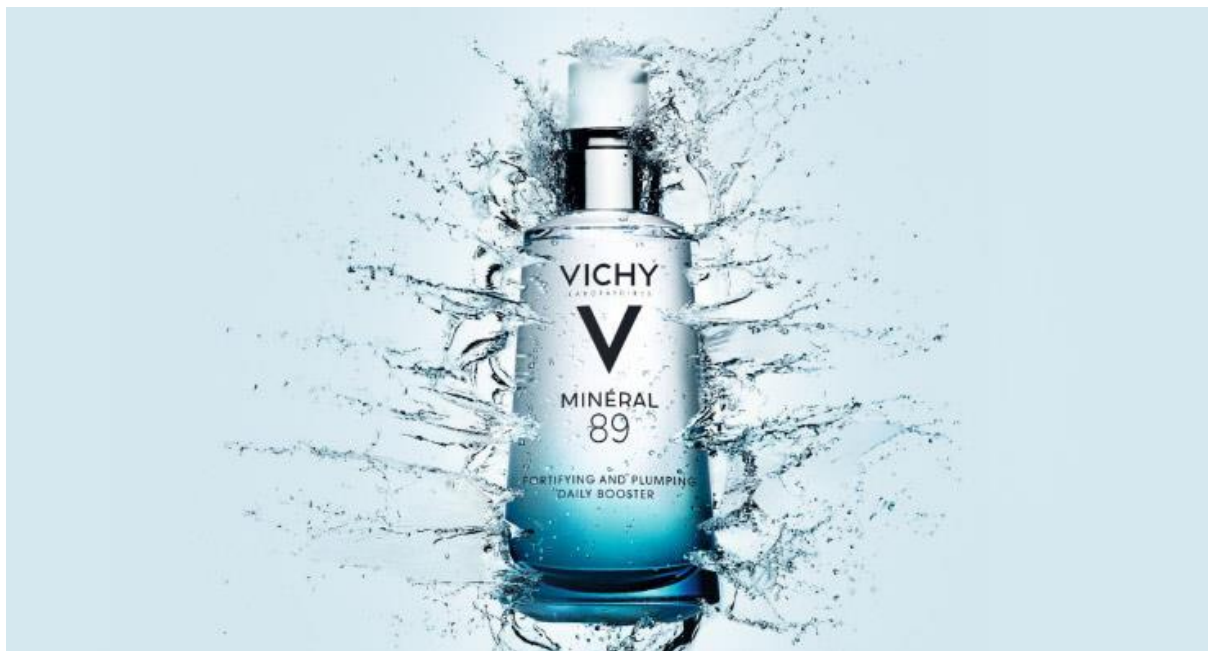
Slika 4 Vichy Mineral 89