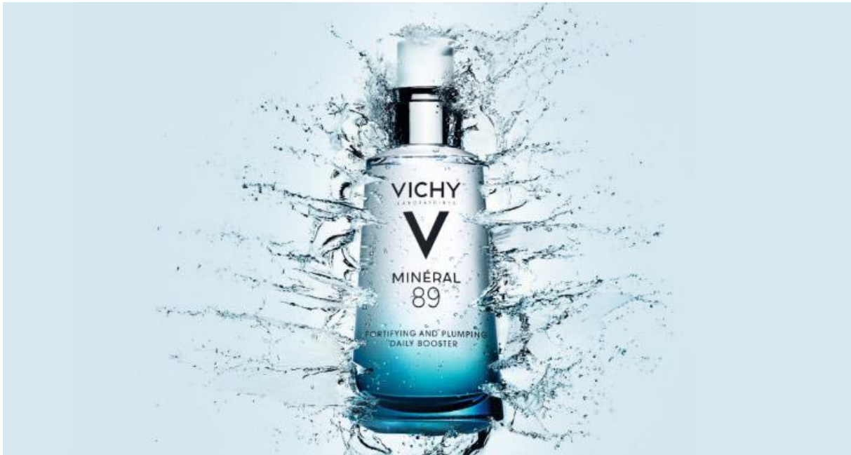
Slika 4 Vichy Mineral 89