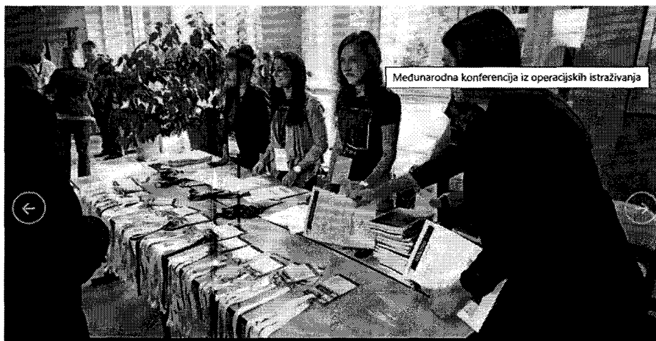
Slika 3: Međunarodna konferencija iz operacijskih istraživanja u Osijeku 2016. godine

Od 2008. do 2013. objavljuje se jedan svezak godišnje časopis koji je sadržavao odabrane radove s konferencija KOI 2010 i KOI 2012. Počevši od 5. sveska, broj 1. (2014.), časopis izlazi dva puta godišnje, a sadrži redovita izdanja izvan konferencije KOI. Također od 2014. suizdavači časopisa su: Sveučilište u Osijeku, Ekonomski fakultet; Sveučilište u Osijeku, Odjel za matematiku; Sveučilište u Splitu, Ekonomski fakultet i Sveučilište u Zagrebu, Ekonomski fakultet (Hrčak, 2020).