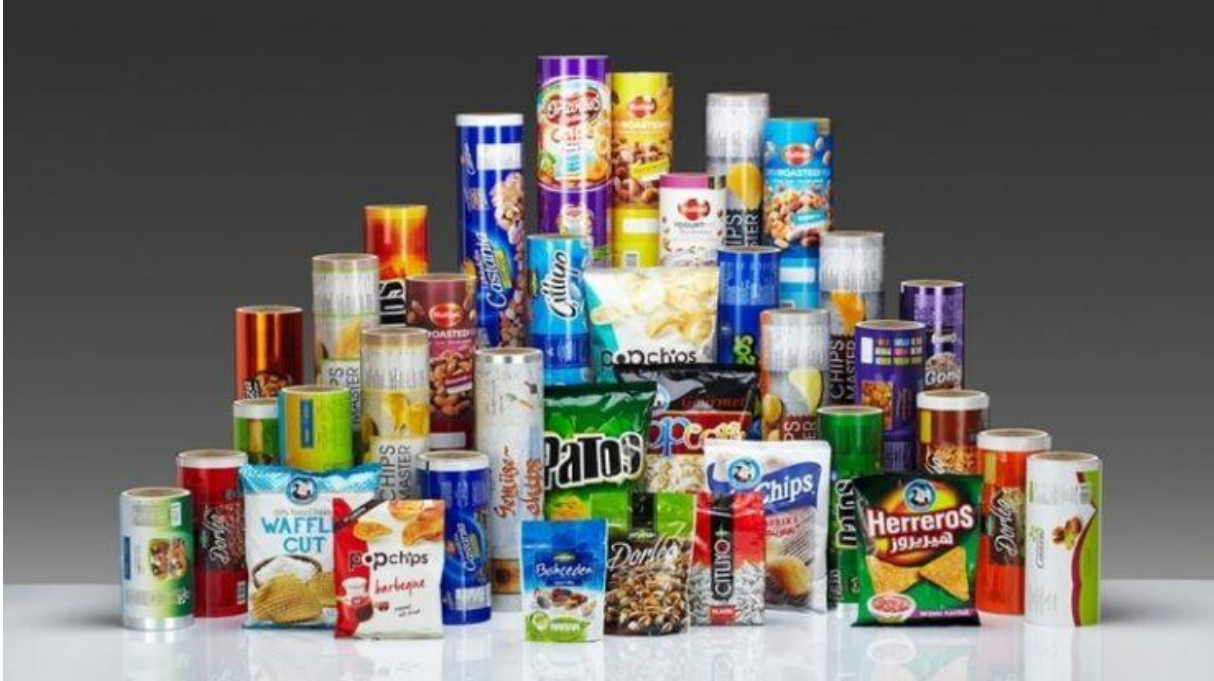
Slika 2: Vrste ambalaže

Pod pojmom ambalaže podrazumijeva se sve ono u čemu je proizvod smješten, kao i materijal kojim je proizvod omotan. Praktično sve što kupujemo i što je moguće naći na tržištu dolazi u nekoj vrsti ambalaže.