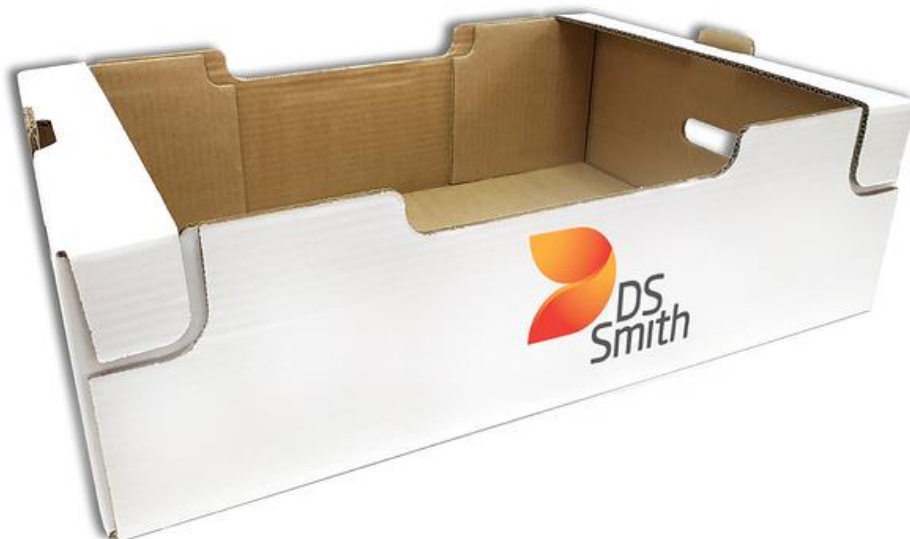
Slika 4: Kartonska ambalaža za voće i povrće

Pametno osmišljena ambalaža produžuje rok trajanja namirnicama te tako i smanjuje otpad hrane. Kartonska ambalaža za voće i povrće može izaći u susret mnogim izazovima. Ona je dostupna u različitim varijantama; čvrsta je, ergonomska i prilagodljiva; biorazgradiva i 100% reciklirajuća; održava svježinu proizvoda do 3 dana dulje od ostale ambalaže; te omogućuje besplatnu promociju brenda kroz atraktivan dizajn kutije.