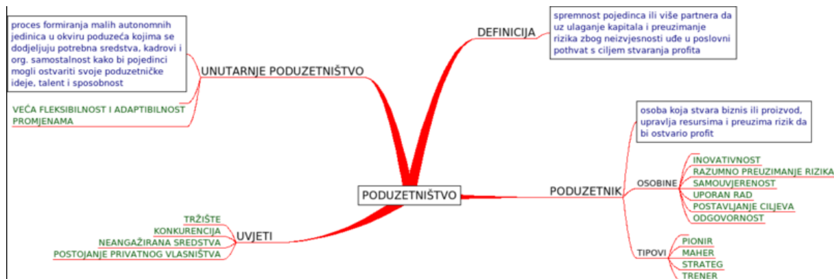
Slika 6.: Mentalna mapa poduzetništva

od rezultata primjene informacijske tehnologije. Funkciju upravljanja informacijskim sustavima i s informacijskom tehnologijom vrlo je teško izdvojiti u posebnu jedinicu pri evaluaciji njezinih učinaka i utjecaja na cjelokupno poslovanje. Ona zapravo predstavlja potpunu djelatnost svim poslovnim funkcijama i poslovnim procesima te predstavlja mogućnost unapređenja njihova funkcioniranja.“ (Breslauer i Gregorić, 2015)