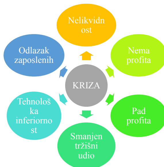
Slika 4.: Simptomi krize

Strategija u kriznim uvjetima (slika 4) je priča za sebe i prvo se mora definirati kriza koja „označava situaciju u kojoj poduzeće nema adekvatne resurse, kompetencije za konkuriranja u polju ili su u okolini poduzeća prisutni procesi koji ugrožavaju opstanak poduzeća.“ Slika 4 prikazuje simptome krize.