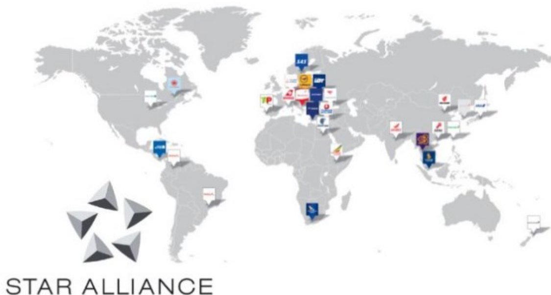
Slika 7.: Savezni partneri Star Alliance-a