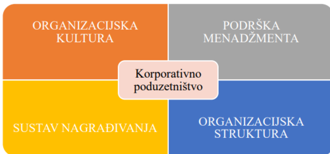
Slika 2.: Faktori koji utječu na važnost korporacijskog poduzetništva

Faktori koji utječu na korporacijsko poduzetništvo su organizacijska kultura, podrška menadžmenta, sustav nagrađivanja i organizacijska struktura kao što je prikazano na slici 2.