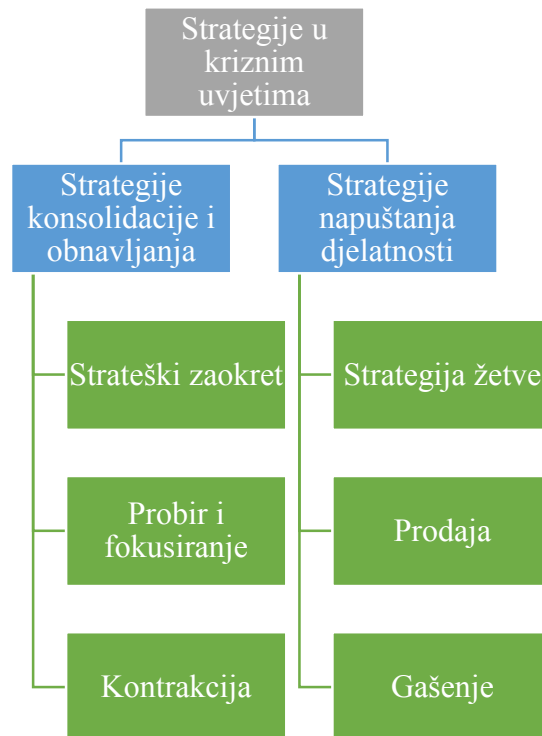
Grafikon 2.: Podjela strategija u kriznim uvjetima

Kriza je sasvim normalna i prihvatljiva u korporativnom poduzetništvu jer ne može uvijek svaka inovacija ili pothvat uspjeti zato je jako važno objašnjenje ove strategije u okviru korporacijskog poduzetništva, a da ova strategija također ima svoje strategije koje su prikazane na grafikonu 3.