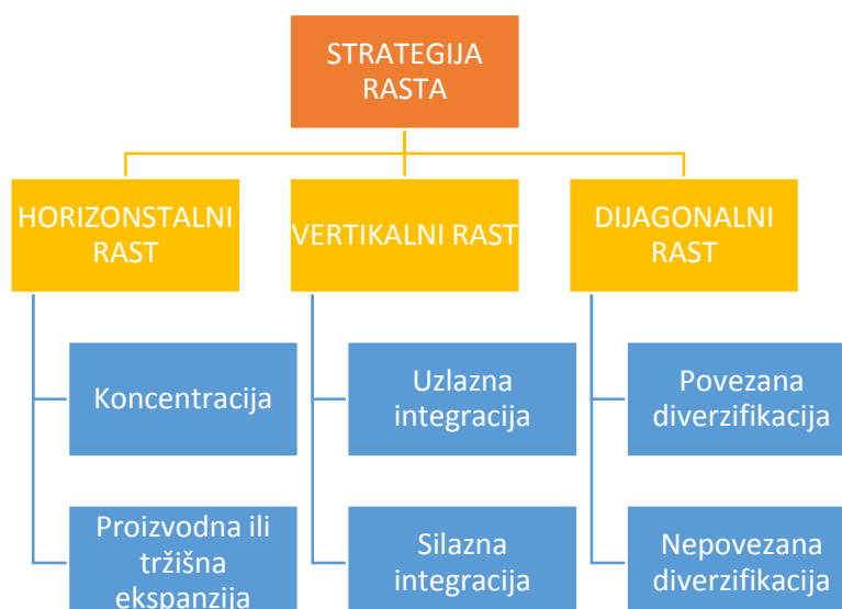
Grafikon 2: Podjela strategije rasta

Sama strategija rasta će se najbolje opisati grafikonom 2: