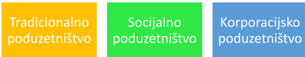
Slika 1.: Vrste poduzetništva

Danas postoji jako puno vrsta poduzetništva, kao na primjer poduzetništvo novih proizvoda, novih tehnologija, imigrantsko poduzetništvo i tako dalje. U bilo kojem području koje uključuje poduzimanje nekog pothvata postoji poduzetništvo, no tri su glavne podijele poduzetništva: tradicionalno, socijalno i korporacijsko kao što prikazuje Slika 1.