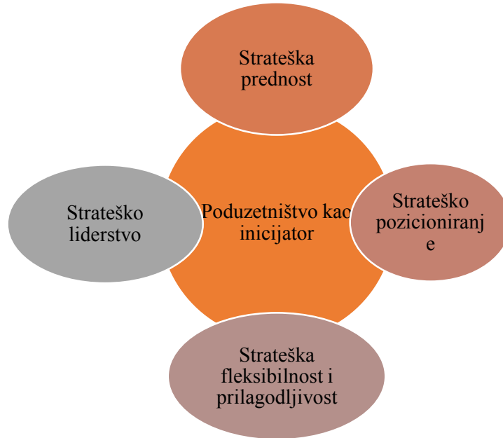
Grafikon 3.: Poduzetništvo kao inicijator

Zaključno sa potpoglavljem o tehnologiji možemo povezati sa inicijativom, tj poduzetništvom kao inicijatorom koje ima razne prednosti i strategije te su slikovito prikazane na grafikonu 6.