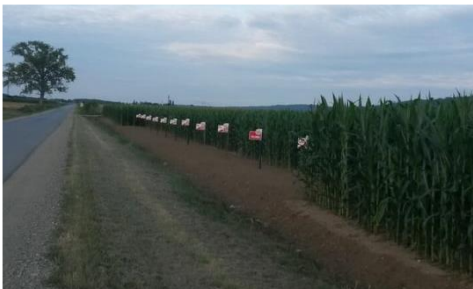
Slika 8 Kukuruz, ogledno polje OPG-a Strajnić