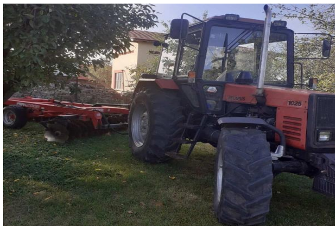
Slika 2 Obiteljski traktor i tanjurača