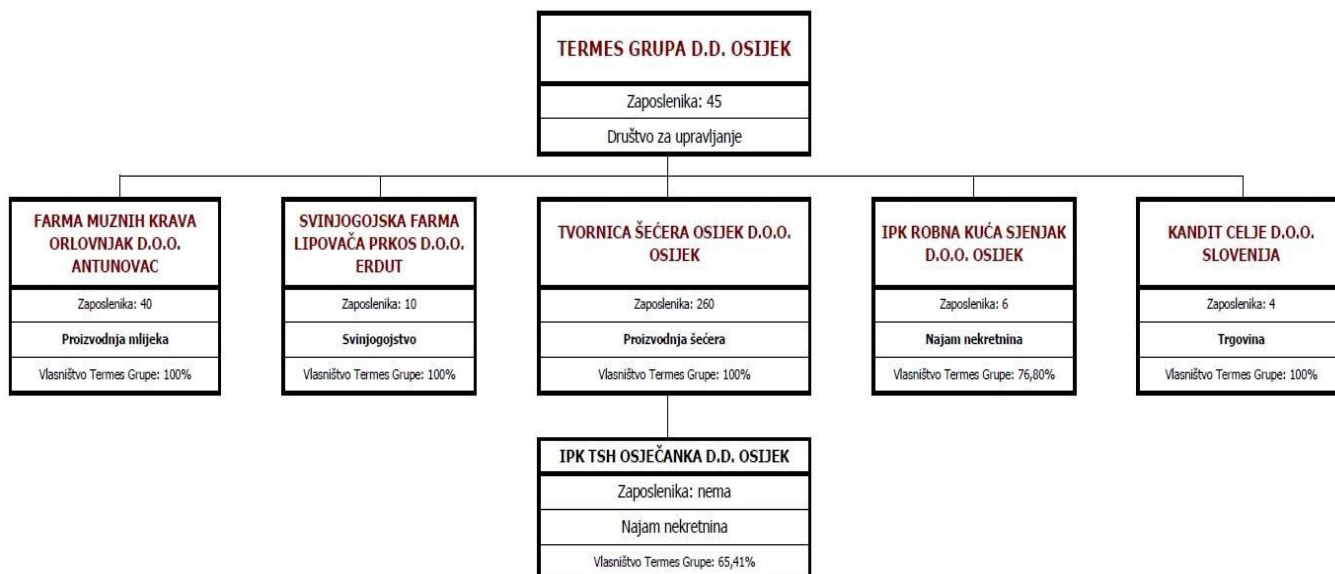
Slika 5. grupacija Termes, tvrtke kćeri

Termes grupa d.d. Osijek je Tvrtka čiji je osnovni poslovni zadatak rukovođenje s članicama Grupe u cilju ostvarivanja što boljeg poslovnog rezultata za svako Društvo Grupe. Termes Grupa d.d. Osijek je slijednik tvrtki čije poslovanje seže preko stotinu godina unatrag i čije su se tvrtke bavile proizvodnjom šećera i konditorskih proizvoda u gradu Osijeku. Danas Termes Grupa d.d. obuhvaća nekoliko tvrtki: