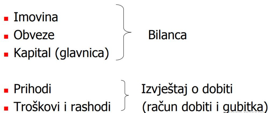
Slika 2.: Financijski izvještaji i elementi financijskih izvještaja

Slika 1. Prikazuje elemente financijskih izvještaja koji se nalaze u neposrednom izravnom odnosu. Pa su tako imovina, kapital i obveze elementi koji su u izravnom odnosu s mjerenjem financijskog položaja u bilanci poduzeća. Elementi koji su u izravnom odnosu s mjerenjem uspješnosti poslovanja poduzeća u računu dobiti i gubitka su prihodi i rashodi. Dok izvještaj o novčanom toku odražava elemente računa dobiti i gubitka kao i promjene elemenata bilance, odnosno novčanih primitaka i izdataka.