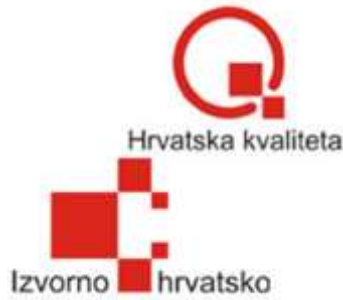
Slika 1 Znak "Hrvatska kvaliteta" i „Izvorno hrvatsko"