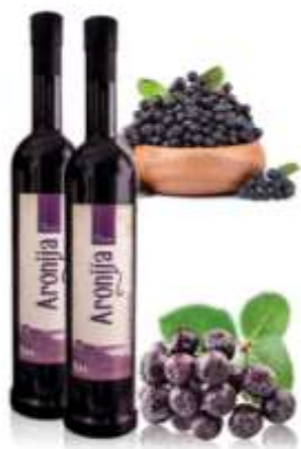
Slika 3 Nagrađivano vino tvrtke Aronia Life