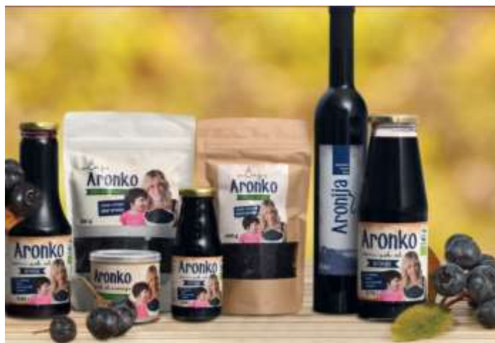
Slika 2 Asortiman tvrtke Aronia Life