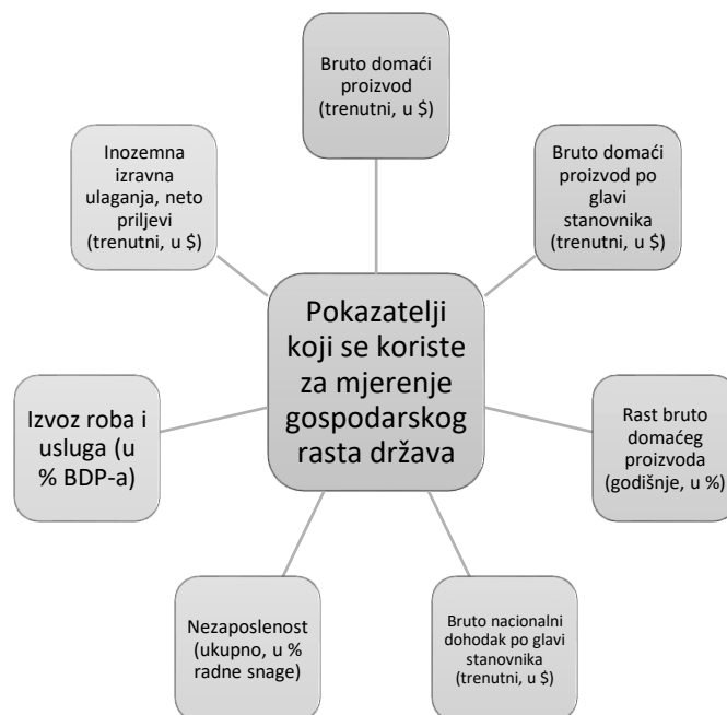
Slika 1. Pokazatelji gospodarskog rasta država

Ne postoji jedinstvena mjera gospodarskog rasta neke države pa je takvo mjerenje moguće provesti određenim pokazateljima. Pokazatelji kojima se iskazuje gospodarski rast države prikazani su na slici 1.