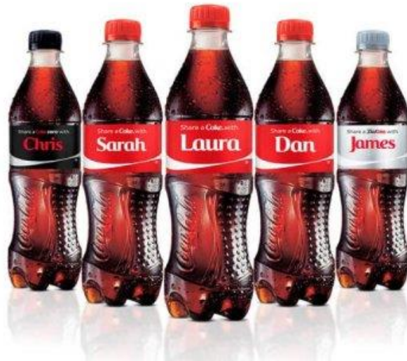
Slika 5. Coca Cola - content kampanja