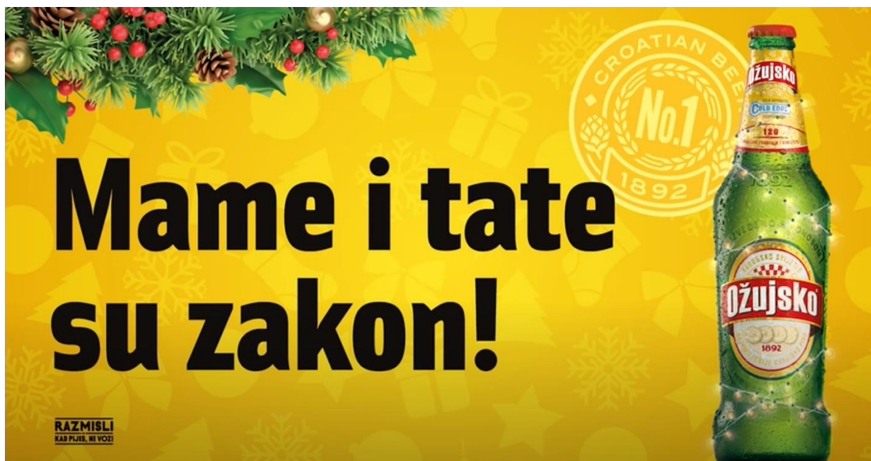
Slika 3. ŽUJA - Mame i tate su zakon!