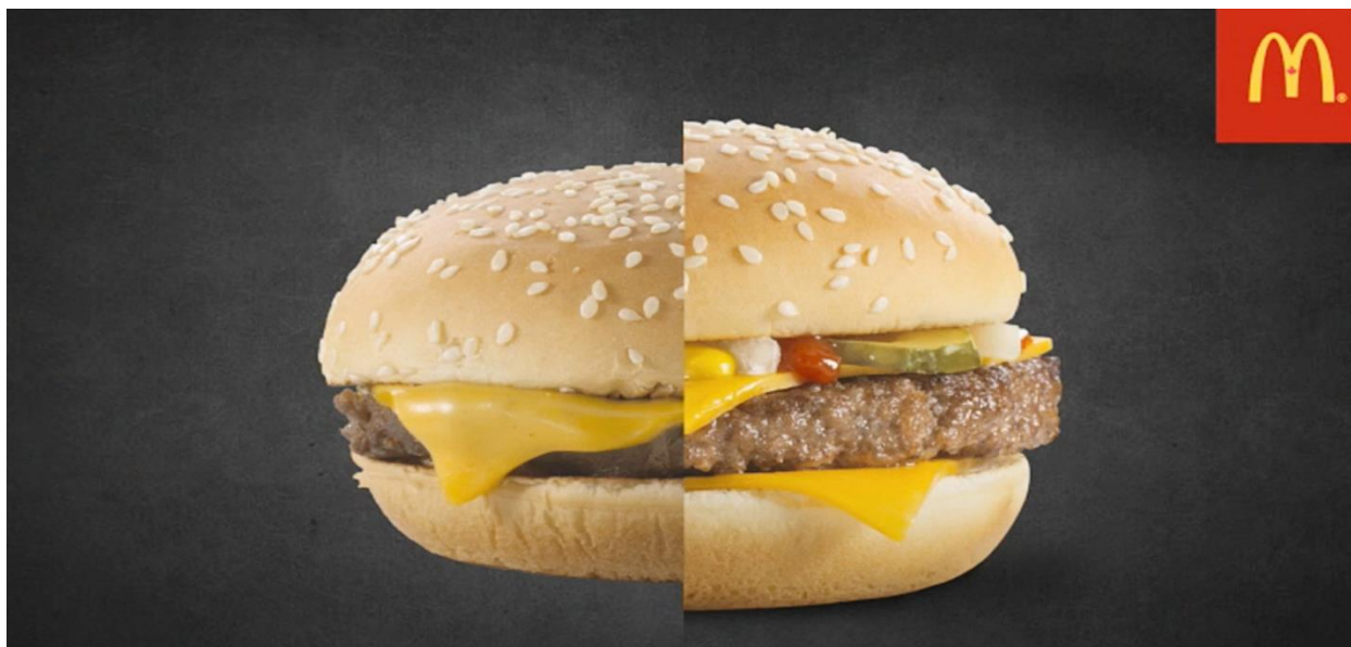
Slika 6. McDonald's content kampanja