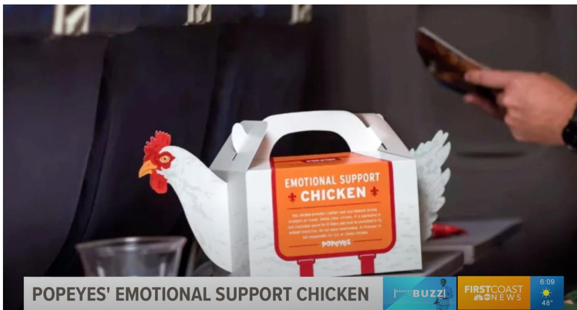
Slika 4. Viralna kampanja - Popeye's

„Kampanja Popeyes-a postala je viralni hit nakon što je na međunarodnom aerodromu u Philadelphiji, fast-food gigant odlučio svoju prženu piletinu posluživati u kutiji u obliku pilića s natpisom „emotional support chicken“ (piletina emotivne podrške)“ (Poslovni Puls, 2018).