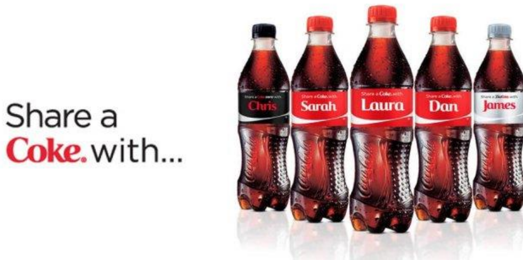
Slika 5. Coca Cola - content kampanja