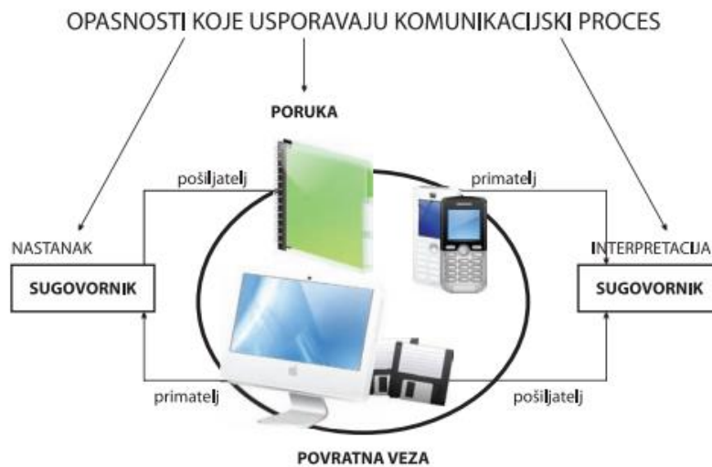
Slika 1: Proces komunikacije