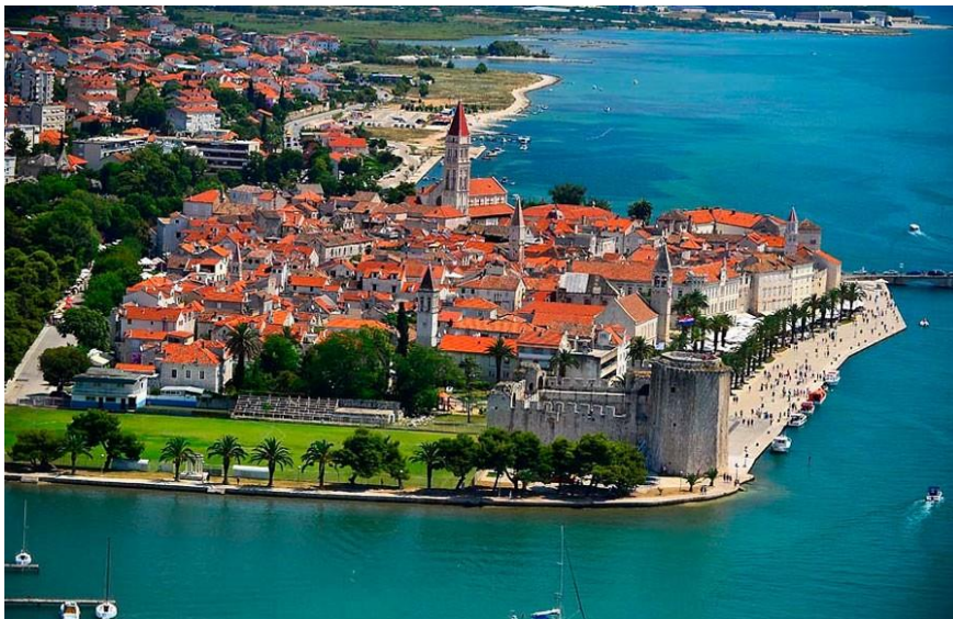
Slika 2.: Trogir 3

Najimpresivnija trogirski građevina je utvrda Kamerlengo u jugozapadnom dijelu grada. Nastala je u 15. stoljeću te je korištena od strane mletačke vojske, po čijem je činovniku za financije (Camerariusu) utvrda dobila ime. Utvrda se danas koristi kao ljetna pozornica te je dom raznih manifestacija. Suprotno utvrdi Kamerlengo, nalazi se kula sv. Marka koja je također vrlo dobro očuvana. Svojevremeno ove su dvije utvrde bile spojene te su oklijevale napadima Turaka.