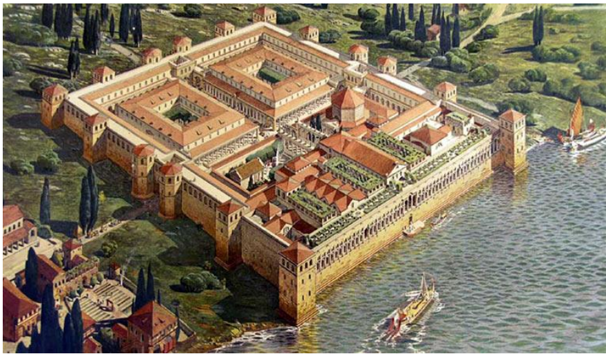
Slika 4.: Dioklecijanova palača 5

godine do svoje smrti jedanaest godina kasnije. Palača je izgrađena kao kombinacija luksuzne vile i rimskog vojnog logora. Dvije glavne ulice palaču su dijelile na četiri dijela. Južni dio bio je predviđen za cara i njegove odaje, dok je sjeverni dio sadržavao zgrade namijenjene vojsci, posluzi i spremištu. Palača je građena bračkim kamenom, a ukrasni detalji i dekoracije kao sfinge i mramor uvezeni su iz Egipta, Grčke i Italije. Palača je za vrijeme gradnje bila udaljena od tadašnjeg grada Salona šest kilometara, zbog čega je trebala dodatnu sigurnost u vidu 16 kula koje su ju okruživale.