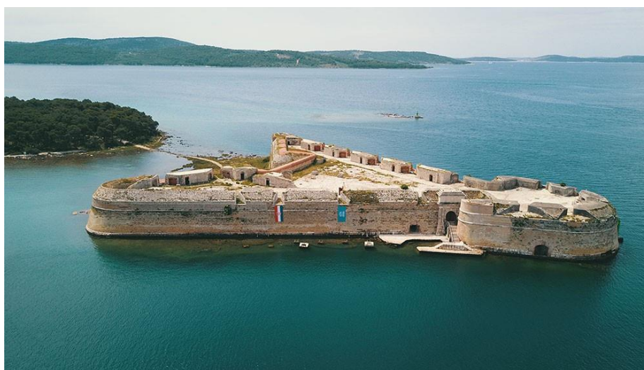
Slika 12.: Utvrda sv. Nikole u Šibeniku 14

Utvrda sv. Nikole u Šibeniku izgrađena je Sredinom 16. stoljeća na otočiću Ljuljevcu. Bio je to veliki zahvat za grad Šibenik i mletačku vlast koja je tada gospodarila Šibenikom. Glavni motiv podizanja utvrde bili su Turski napadi, naročito nakon pada obližnjeg grada Skradina pod tursku vlast 1522. godine. Utvrda se nalazi na samom ulazu u kanal sv. Ante koji vodi do Šibenika. Trokutastog je oblika što je u to vrijeme bila prava rijetkost u Hrvatskoj, ali i u Europi. Južna strane utvrde povezana je sa kopnom malim puteljkom prohodnim za pješake, dok je sjeverna strana primarno služila za nadgledanje kanala.