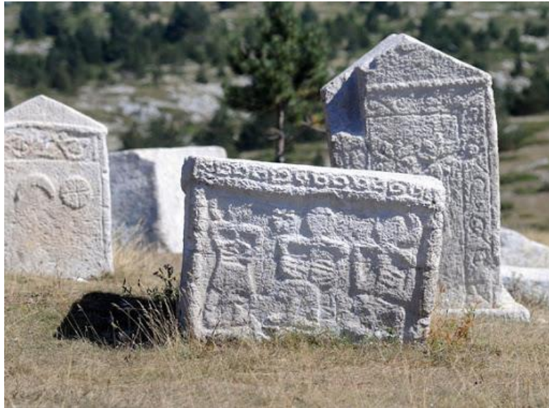
Slika 10.: Stećak 12