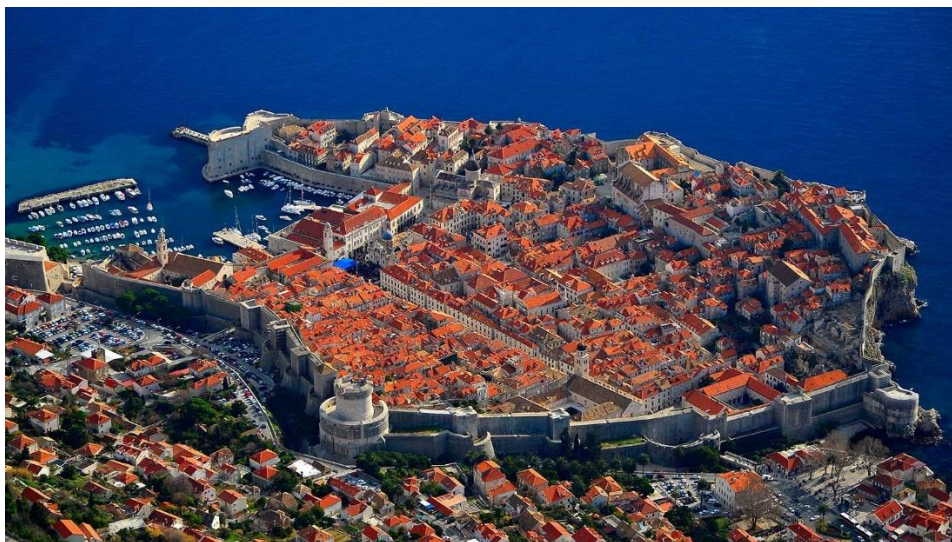
Slika 1.: Dubrovnik 2

UNESCO je zbog svih vrijednosti i posebnosti koje ovaj grad ima, 1979. godine Dubrovnik uvrstio u popis svjetske baštine.