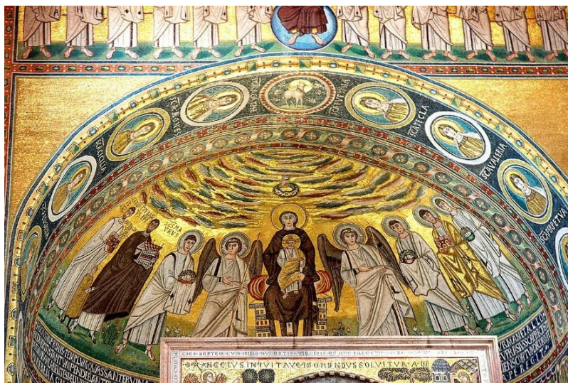
Slika 7.: Marija Bogorodica - Eufrazijeva bazilika 8

Posebnost Eufrazijeve bazilike je što srednje mjesto u apsidi zauzima Marija Bogorodica, dok je do tada to mjesto pripadalo isključivo Isusu Kristu. Bogorodica sjedi na prijestolju te u naručju drži novorođenog Isusa, obučenog u rimsku svečanu odjeću s desnom rukom podignutom za blagoslov. UNESCO je prepoznao vrijednost ove crkve, te 1997. godine Eufrazijevu baziliku dodao na popis svjetske materijalne baštine.