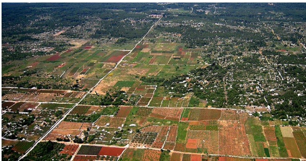
Slika 9.: Starogradsko polje 11

Stari grad smješten je u zaljevu na sjeverozapadnom dijelu otoka Hvara, a ujedno je i najstariji grad na otoku. Još u 4. stoljeću pr. Krista Grci su osnovali grad pod imenom Pharos, u blizini kojeg se nalazilo starogradsko polje. Navedeno polje je najveće i najplodnije polje na otoku Hvaru, ali i na svim otocima Jadrana. Prostire se na 6 kilometara dužine, a njegova vrijednost prepoznata je još za vrijeme antičke Grčke kada su Grci polje podijelili na jednake pravokutne dijelove. Polje je suhozidom podijeljeno na 73 jednaka dijela, veličine 181 puta 905 metara.