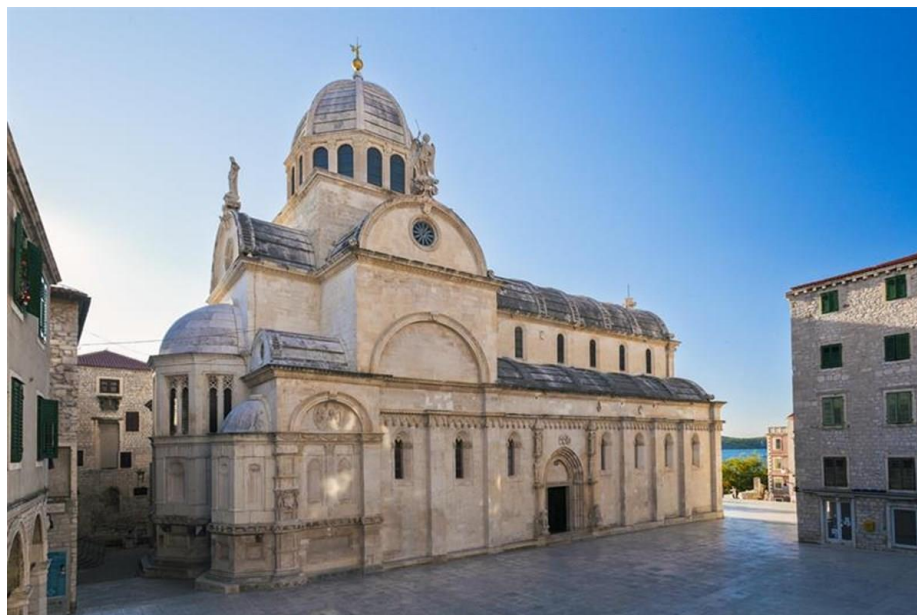
Slika 6.: Katedrala svetog Jakova u Šibeniku 7

Centralne komisije za historijske i umjetničke spomenike, te je katedrala u originalnom obliku ostala sačuvana do danas.