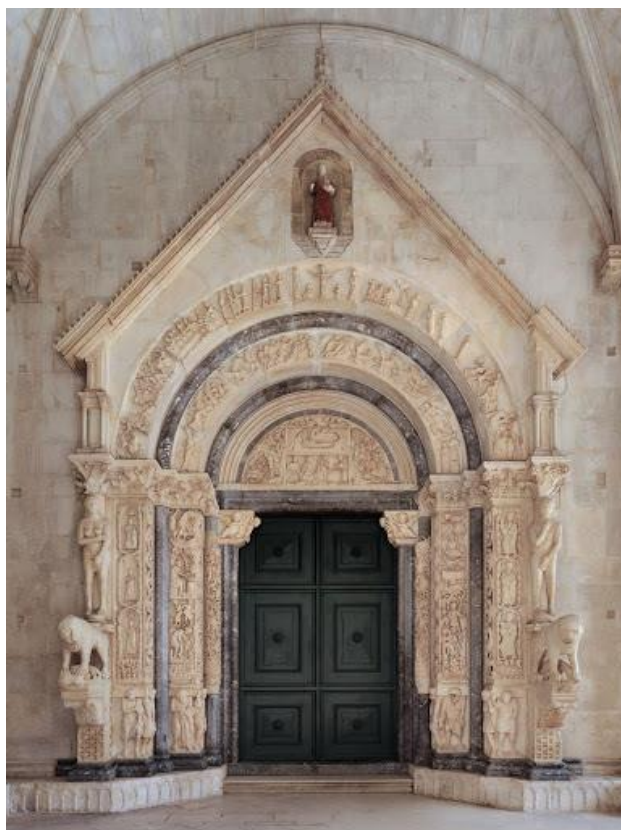
Slika 3.: Radovanov portal 4

Posebno treba istaknuti ulaz u katedralu i romanički Radovanov portal iz 1240. godine, remek djelo najvećeg hrvatskog kipara - majstora Radovana. Radovanov portal smatra se najznačajnijim srednjovjekovnim portalom u ovom dijelu Europe, a prikazuje scene iz života Isusa Krista. Uz portal nalaze se i lavovi nad kojima su kipovi Adama i Eve.