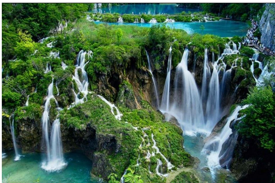
Slika 8.: Plitvička jezera 9

Plitvička jezera skup je 16 kristalno modrozelenih jezera, međusobno povezanih slapovima, kojima se jezera prelijevaju jedno u drugo. Smještena su u unutrašnjosti gorske Hrvatske, na izvoru rijeke Korane, između obronaka Male Kapele na zapadu i sjeverozapadu i Ličke Plješivice na jugoistoku. Nadmorska visina parka iznosi od najnižih 480 do najviših 636 metara, gdje se nalazi i najveće Prošćansko jezero. Najveći dio parka zapravo je šumsko područje (81%) gdje prevladavaju bukva i jela, a manji dio parka prekrivaju travnjaci, odnosno njih 15 posto. Površine izmijenjene antropogenim djelovanjem zauzimaju tri posto, dok vodene površine prekrivaju tek 1 posto parka. Formiranje jezera odvija se već desetak tisuća godina, a arheološka istraživanja pokazuju kako je područje Plitvica naseljeno od prapovijesnih vremena.