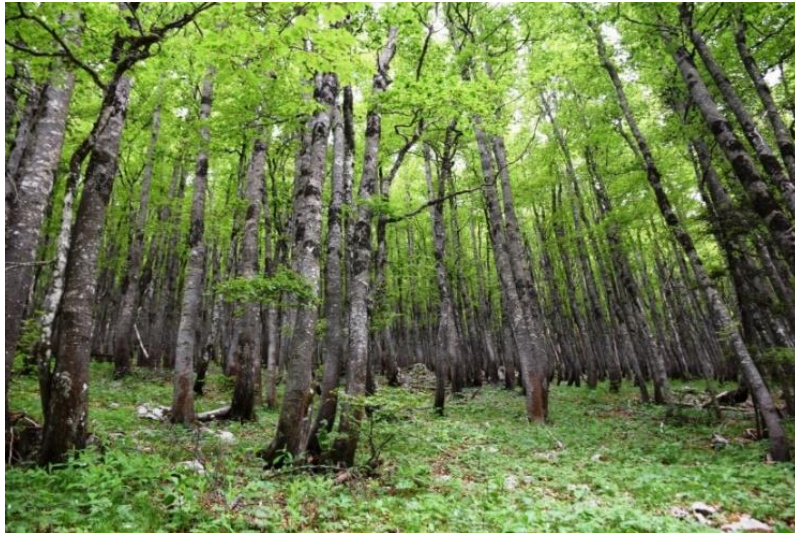
Slika 11.: Bukove šume 13

Radi se o 1289,11 hektara bukove šume u strogom rezervatu "Hajdučki i Rožanski kukovi" u sklopu Nacionalnog parka Velebit, dok je nacionalni park Paklenica bogat bukovim šumama sa 2031,87 hektara na lokacijama Suva draga – Klimenta i Oglavinovac – Javornik. Šume Nacionalnih parkova Velebit i Paklenica vrijedne su iz više razloga, a ponajviše zbog iznimne starosti, veličine, ali i geografskog položaja samih parkova. UNESCO zaštita bukovih šuma potvrđuje kako se prirodnim ljepotama Hrvatske upravlja s ciljem zaštite za buduće generacije, kao i to da je po bioraznolikosti Hrvatska među najbogatijim državama Europe.