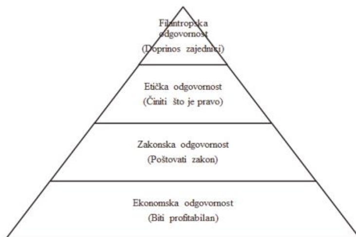
Slika 1 Carrollova piramida