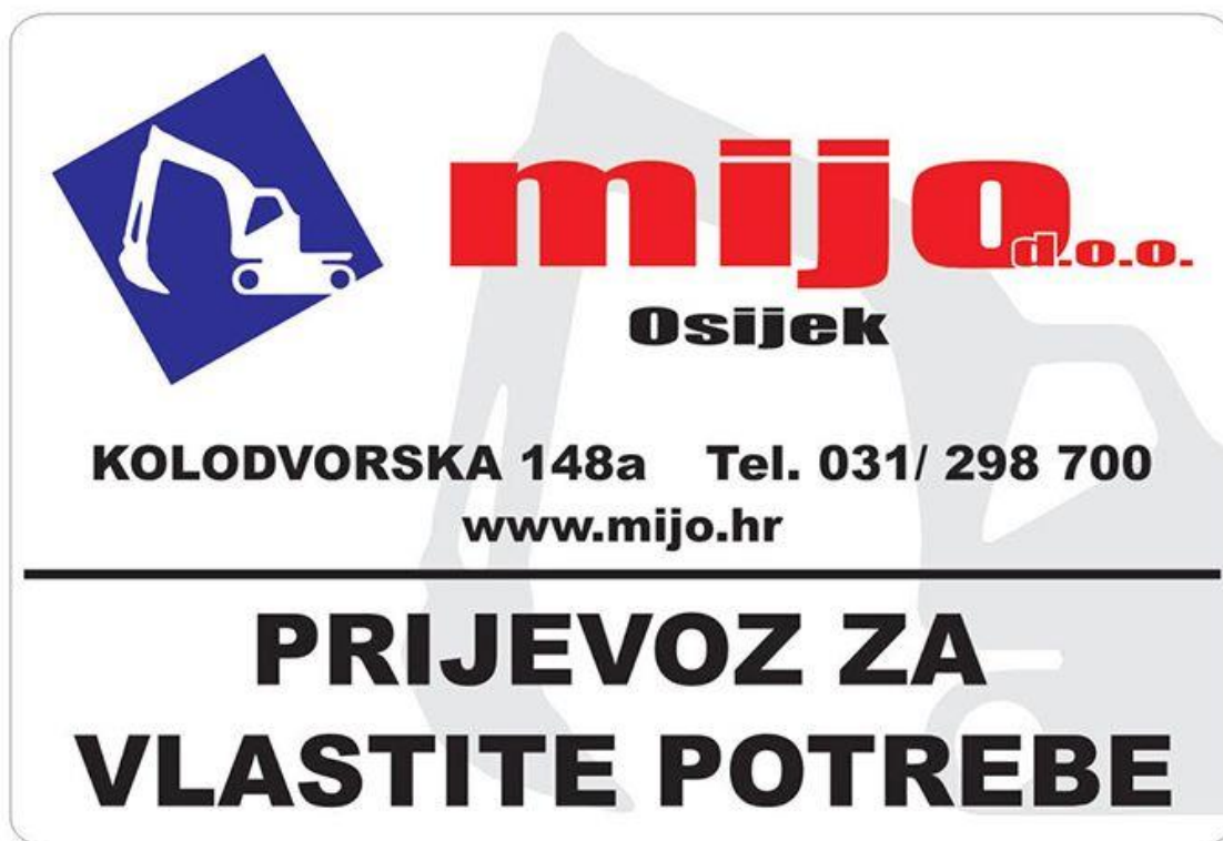
Slika 2: Logo poduzeća Mijo d.o.o. Raspoloživo na: https://www.mijo.hr/ [pristupljeno: 13. travnja 2021]

Utvrdra d.o.o. je građevinska tvrtka s lokacijom u Višnjevcu koja se specijalizirala ta Gradnju stambenih i nestambenih zgrada. Osnovana je 1998. godine te spada u mala i srednja poduzeća i iznimno je cijenjena na području građevine. Danas u tvrtki izvode građevinske radove, novogradnju, gradnju obiteljskih kuća, zidarske radove, adaptacije objekta, adaptacije potkrovlja, adaptacija kuće, adaptacija stanova, adaptacija kupaonica, krovopokrivačke radove, tesarske radove, fasaderske radove, suhu gradnju, zidarske radove, keramičarske radove. Najveći dio poslovanja izvode u regiji i okolnim županijama. Iz tvrtke naglašavaju kako poslovanje provode savjesno i profesionalno, te maksimalno poštuju zadane rokove ugovorenih poslova što osigurava povjerenje klijenata. Od samog početka uspostavljanjem pouzdane, sigurne i prijatne suradnje trudimo se da nađemo optimalno rješenje kako bi konačna izvedba upravo odgovarala zamislama. Dakle tvrtka maksimalno personalizira izvedbu radova što dodatno utječe na nabavku robe. Specijalizirana gradnja zahtjeva izradu i nabavu materijala po mjeri i željama klijenata, a iako je nekada skuplje, osigurava kvalitetu i zadovoljstvo klijenata. U tvrtvi koriste najnoviju opremu, alate i strojeve, te garantiraju kako kvalitetu tako i brzinu i efikasnost. Djelatnici imaju dugogodišnje iskustvo u svom radu. Osiguranje zadovoljstva klijenata je najveći poticaj da tvrtka daljim nastojanjima da ponudi bolju uslugu