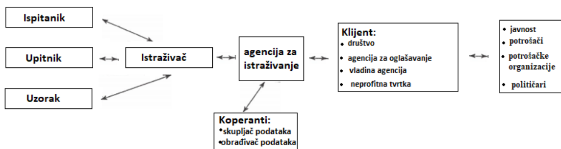
Slika 4. Ključni elementi u procesu istraživanja tržišta (vlastita izrada prema Jepsen Schmidt, 2011:80)

Istraživači imaju odgovornost prema pravednom ispitivanju sudionika postupka istraživanja tržišta. On im mora reći istinu o prirodi i svrsi istraživanja. Također istraživači moraju prikupiti točne i pouzdane podatke za svoje klijente. U slučaju kada ispunjenje ovih odgovornosti stvara sukob javlja se upravo problem etike istraživanja (Jepsen Schmidt, 2011:79-80). Na Slici 4 se nalazi prikaz svih ključnih elemenata koji su uključeni u proces istraživanja tržišta.