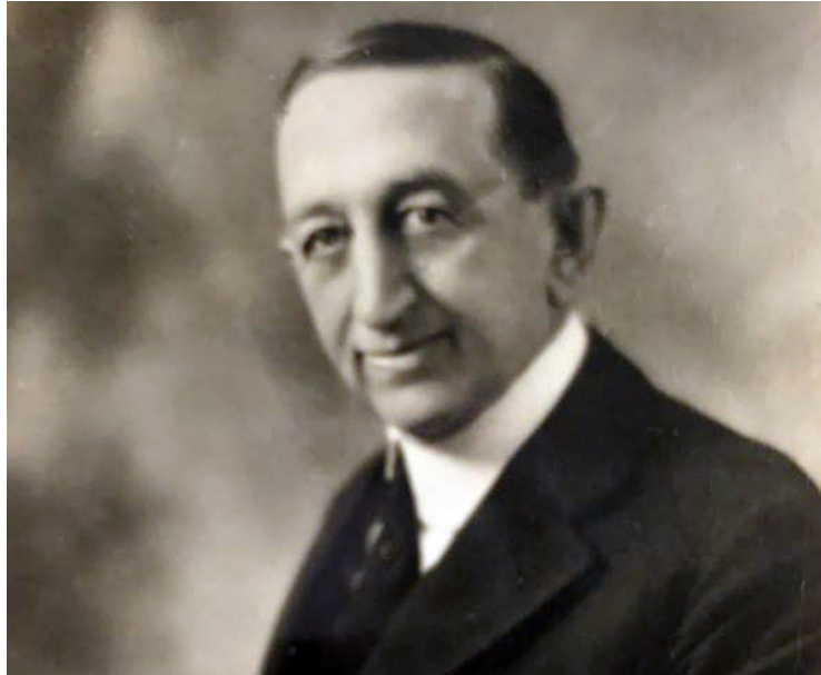
Slika 1. Začetnik istraživanja tržišta (Harford, 2017.)

S druge strane, Meler (2005:28) smatra da je istraživanje tržišta započelo 1879. godine s agencijom N. W. Ayer & Son koja je napravila „prvo sustavno istraživanje državnih i lokalnih službenika za spoznavanje njihova predviđanja proizvodnje žitarica za potrebu određivanja vremena oglašavanja za njihova klijenta, tvrtku Nicholas-Shepard Company, proizvođača poljoprivrednih strojeva.“