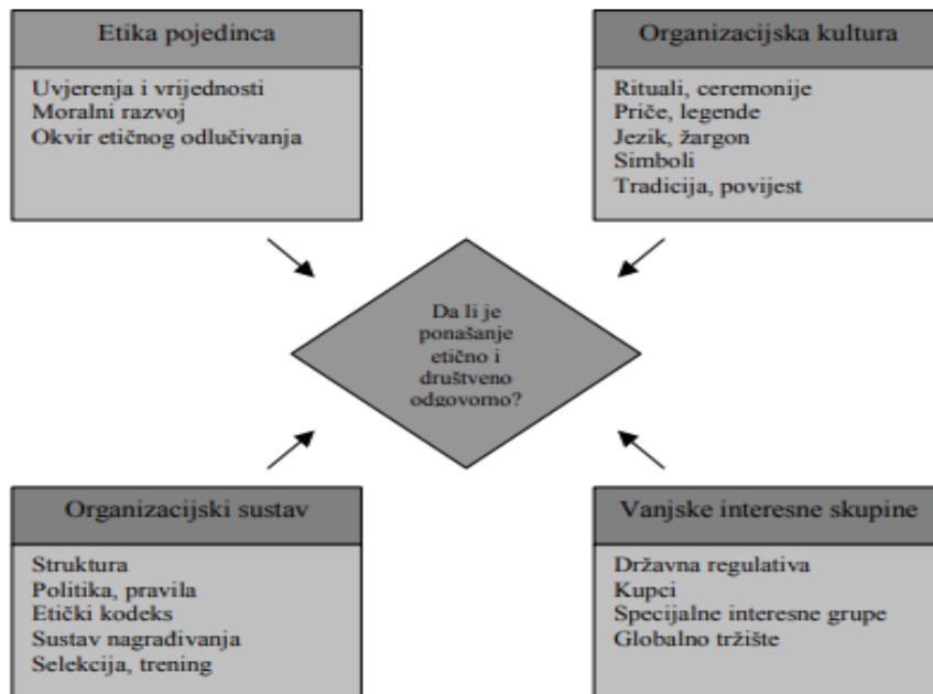
Slika 3. Faktori koji utječu na etično ponašanje (Aleksić, 2007:422).

Etika pojedinca je čimbenik koji djeluje na poslovnu etiku tako da svaka osoba u organizaciji ima svoje vrijednosti, stavove i uvjerenja te ima moral i svoj etički okvir unutar koje odlučuje. Tako na poslovnu etiku djelomično djeluje svaki pojedinac. Organizacijska kultura se odnosi na povijest i tradiciju organizacije, a tome još pripadaju: rituali, ceremonije, jezik, žargon, priče, legende i simboli. Treći faktor je organizacijski sustav. Tu spadaju elementi koji će ostaviti veliki utjecaj na oblikovanje poslovne etike kao što su struktura, kodeks, pravila, politika, trening, selekcija te sustav nagrađivanja. Vanjske interesne skupine su faktor koji također utječe na organizaciju poput države, kupaca i općenito tržišta koji mogu utjecati na etičke standarde.