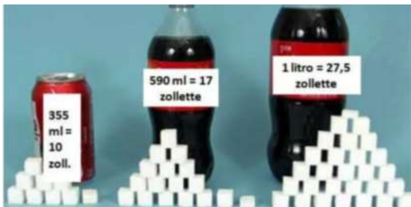
Slika 3. Količina šećera u proizvodu Coca-Cola", maisonjardin.net, 2021.

Njihovo mišljenje je da razlozi pretilosti potrošača nisu nezdrava hrana i korištenje pića punih šećera u zapadnim zemljama, nego samo nedostatak vježbanja. Ovime je ciljano maknuta pažnja sa proizvoda Coca Cola, Sprite, Fanta i drugih pića koji su u vlasništvu tvrtke Coca-Cola. Riječ je o zavaravanju kupaca kako je za rješavanje problema pretilosti dovoljno baviti se tjelesnom aktivnošću, te nije potrebno smanjiti unos kalorija (Biagioli, 2021).