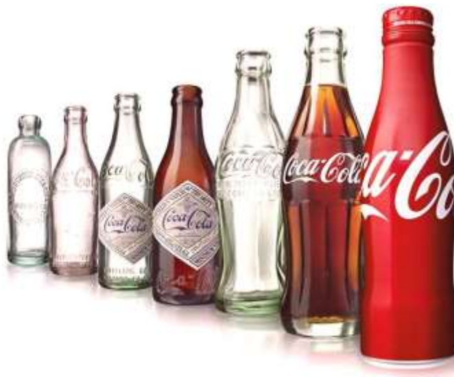
Slika 2. Oblici ambalaže Coca-Cola tijekom godina, andamanislandtrip.com, 2019.

„Njihova marka uključuje proizvode: Coca-Cola, Sprite, Fanta i ostatak bezalkoholnih pića. Njihovu marku kave i čaja čine: Dasani, Smartwater, Vitaminwater, Topo Chico, Powerade, Costa, Georgia, Gold Peak, Honest i Ayataka. Marku biljnih napitaka, prehrane, mliječnih proizvoda i sokova čine: Minute Maid, Simply, Innocent, Del Valle, Fairlife i AdeS“ (The Coca-Cola company, 2021).