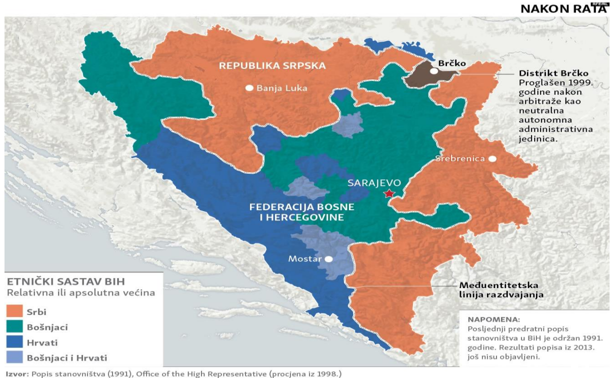
Slika 1: Prikaz etničkog sastava BiH

Ustav BiH je tako najviši pravni akt u pravnom sustavu Bosne i Hercegovine koji je stupio na snagu kao aneks ( dodatak ) međunarodnog sporazuma. Tako se prema Općem okvirnom sporazumu za mir u Bosni i Hercegovini, sama država sastoji od dva entiteta Federacije BiH i Republike Srpske te administrativne jedinice lokalne samouprave pod suverenitetom države BiH – Brčko Distrikt.