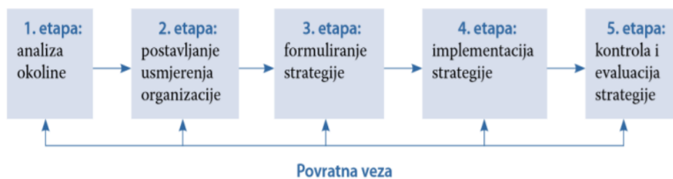
Slika br. 1. Proces strateškog menadžmenta

Izvor: Buble M., Strateški menadžment, Sinergija, Zagreb, 2005, str. 8