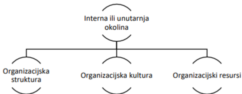
Slika br. 2 Interna okolina

Interna ili unutarnja okolina poduzeća je u potpunosti pod utjecajem poduzeća, Internu okolinu čine organizacijska kultura, organizacijska struktura i resursi, kao što je prikazano na slici broj 2.