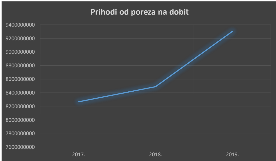
Graf 1. Prihodi od poreza na dobit od 2017. do 2019. godine

Na grafu 1. su prikazani prihodi od poreza na dobit kroz razdoblje od 2017. do 2019. godine te ta crta trenda predstavlja stalni rast prihoda te pozitivnu tendenciju k napretku ubiranja sve više novca od poreza na dobit.