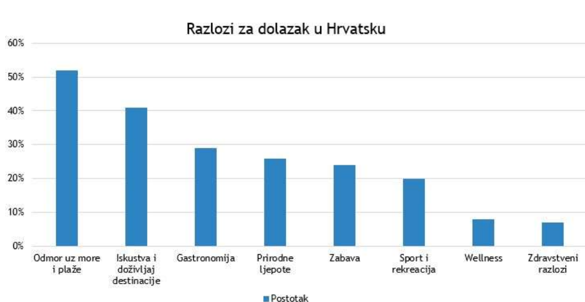
Slika 1. Razlozi dolaska na odmor u Hrvatsku