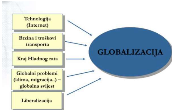
Slika 1. Uzroci globalizacije

Globalizacija je postojala puno prije nego li se o njoj počelo tako intenzivno diskutirati. Neki od uzroka globalizacije koji se najčešće izdvajaju su prikazani na slici 1.