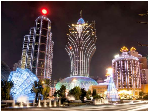
Slika 4. Casino u Macau