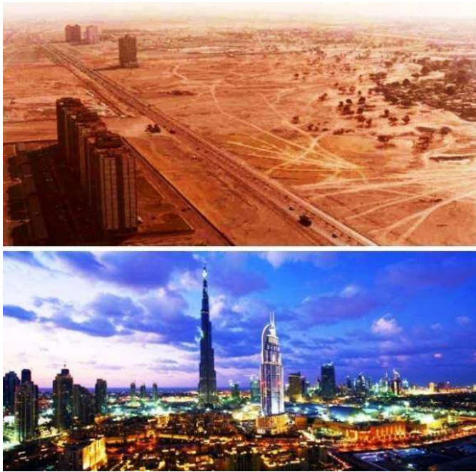
Slika 2. Dubai 1990. i 2003.