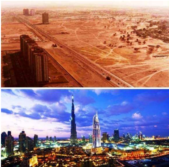
Slika 2. Dubai 1990. i 2003.