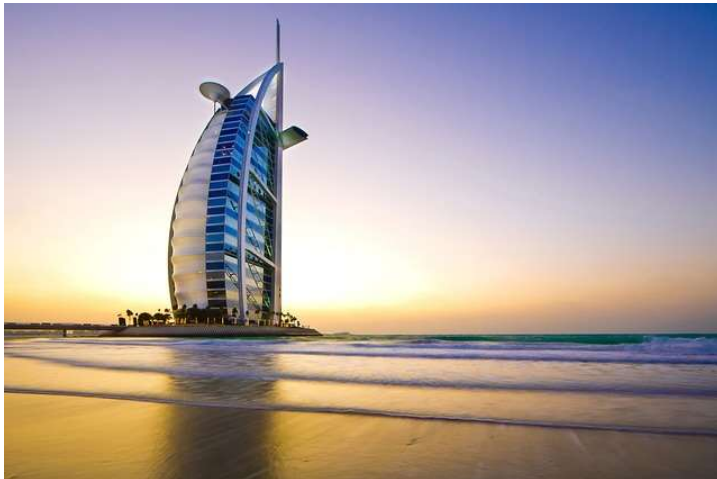
Slika 3. Hotel Buraj Al Arab