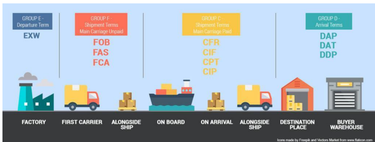
Slika 1.: Podjela INCOTERMS® pravila po glavnim grupama

Shipment term main Carriage paid , hrv. termin rok i glavni prijevoz plaćen) i Grupa D (engl. Arrival Terms hrv. uvjeti dolaska). ( https://fbabee.com/incoterms/ ) Svaku osnovnu grupu čine INCOTERMS® pravila po kojima se definiraju odgovornosti pri sklapanju ugovora o kupoprodaji, obveze prodavatelja i kupca, te troškove prijevoza između prodavatelja i kupca. Koje će se pravilo INCOTERMS® primijeniti, ovisi o sklopljenom kupoprodajnom ugovoru između prodavatelja i kupca, vrsti i načinu prijevoza. Ukoliko nastane šteta, njihovom pravilnom primjenom može se utvrditi točka prijenosa rizika s prodavatelja na kupca ili s kupca na prodavatelja, odnosno tko će snositi troškove štete. Na slici 1. prikazana je podjela INCOTERMS® pravila po glavnim grupama. (ICC,2019.)